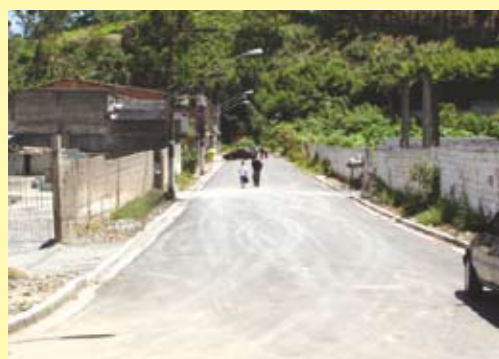
Rua Lídia Maria