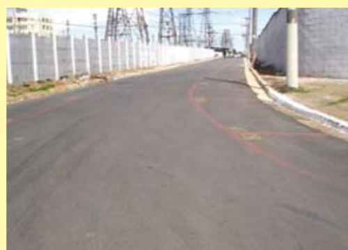
Rua Simão Álvares Mousinho