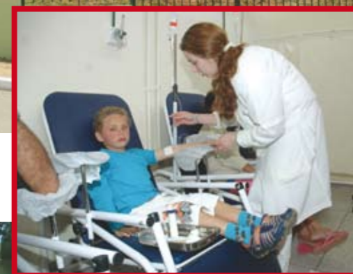
São Francisco II (acima) e Jardim das Laranjeiras (abaixo): atendimento melhor e novos equipamentos