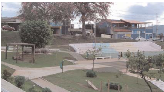
A praça: piso reformado pista de corrida, mesas de xadrez

A praça Vigário João Gonçalves de Lima, mais conhecida como praça do Samba, está de cara nova. Ganhou equipamentos de ginástica e lazer.