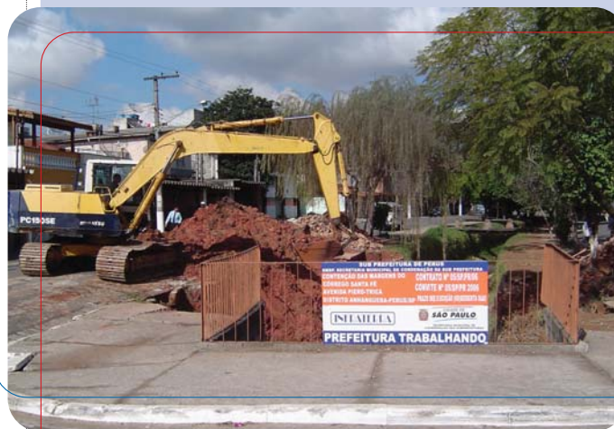
Córrego Santa Fé: início das obras na rua Piero Tricca

Depois das obras no córrego Perus, chegou a vez das melhorias no Córrego Santa Fé