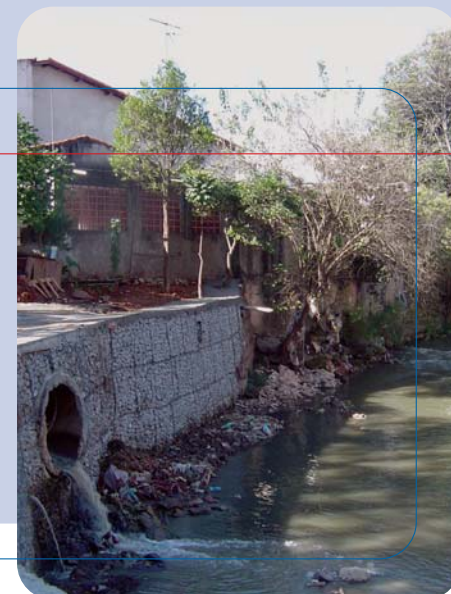
Córrego Perus: muro na rua Dr. João Rodrigues de Abreu