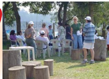
Comunidade em ação: limpeza de lixo e entulho nas margens.

A Light criou uma barragem. Nasceu um reservatório que hoje abastece 4 milhões de pessoas.