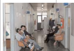
Sem parar: a reforma do pronto-socorro (ao lado) não interrompeu o atendimento (no alto)