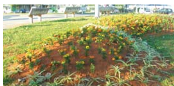
A espera do plantio: mudas serão plantadas este mês

Um acordo assinado entre a Prefeitura e o Governo do Estado prevê que um possa usar imóveis de propriedade do outro. Um imóvel da Prefeitura localizado na Rua Capitão José Inácio do Rosário pode ser o primeiro a entrar no acordo. Ele seria cedido ao Estado para a construção do novo Fórum da Lapa. Em troca, a sede atual do fórum se transformaria no novo prédio da Subprefeitura.