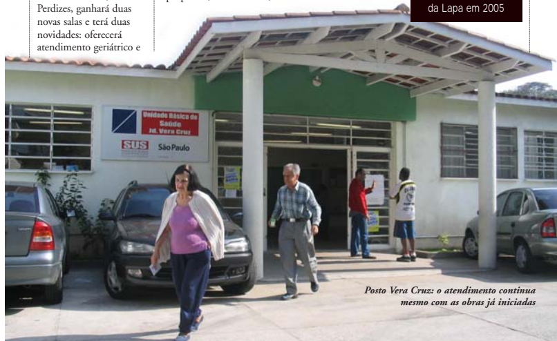
Posto Vera Cruz: o atendimento continua mesmo com as obras já iniciadas

foram feitas no sistema público municipal de saúde da Subprefeitura da Lapa em 2005