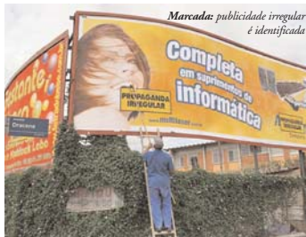
Marcada: publicidade irregular é identificada

são retirados, em média, 850 faixas, placas e caveletes de publicidade colocados irregularmente nos distritos que formam a Subprefeitura da Lapa.