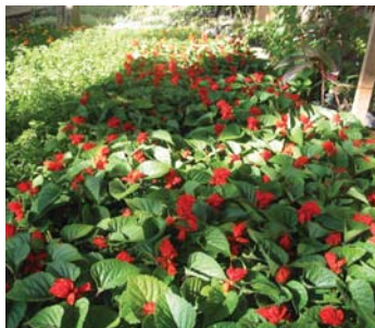
À espera do plantio: mudas serão plantadas este mês

As ruas e praças da Subprefeitura da Lapa vão ficar mais bonitas. Começou a preparação dos canteiros para o plantio do Projeto Corredores de Flores. A primeira praça a ganhar flores será a Dr. Pedro Corasa, na avenida Ernando Marchetti. O canteiro central da avenida Comendador Martinelli ganhará 11 palmeiras. Em seguida serão floridas as praças Apeactu (na Avenida Queiroz Filho) e Márcia Maria Mamana (na avenida Sumaré). Para ornamentar os canteiros, serão usadas espécies de ciclo curto.