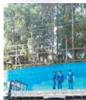
Pichação eliminada: funcionários pintam os muros

Para pedir este serviço ligue 6241-1122, ramal 236