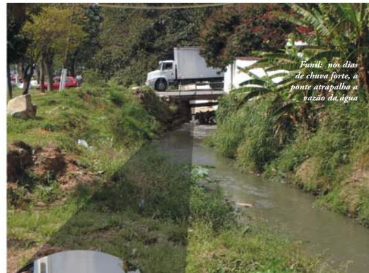
Funil: nos dias de chuva forte, a ponte atrapalha a vazão da água