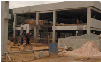
Crescendo: as obras continuam em ritmo acelerado

As obras do novo CEU Tremembé estão adiantadas. A parte estrutural do prédio está quase toda pronta e já dá para ter uma idéia de como vai ficar. A previsão inicial, considerando o ritmo atual das obras, é que o CEU fique pronto até o próximo verão. Mais de 2.400 jovens da região serão atendidos, com escolas, creches, esporte, lazer e cultura.