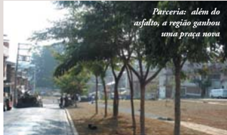
Parceria: além do asfalto, a região ganhou uma praça nova

existia um córrego a céu aberto, a Subprefeitura construiu uma galeria de 130 metros para água de chuva. No lugar do córrego, surgiu uma praça com pista de cooper e um pequeno campo de futebol. O local ganhou três mil m 2 de grama, mudas de flores e árvores adultas.