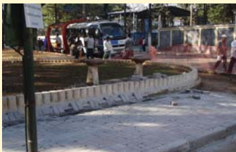
Mais conforto: piso novo na praça João Batista Vasquez.

A Subprefeitura está trocando as calçadas em volta de três praças da região para melhorar a paisagem e a passagem de pedestres. As praças João Batista Vasquez, Memória do Jaçanã e da Avenida Luis Stamatz já ganharam piso novo. A Avenida Guapira também vai ganhar calçada nova. A Subprefeitura fechou uma parceria com os comerciantes, que vão pagar a troca do piso no trecho da avenida que fica