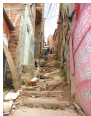
Caos: escadaria será refeita

Os moradores do Jardim Eliane ganharão uma escadaria nova. Será construída a da rua Oscar. Desde o início do ano passado foram feitas escadarias nas ruas Logina, Gondarem, Figueira de Barbaria, Bom Jesus do Monte, Alonso de Mena, Maria Pinto Labiapari e Rio das Contas.