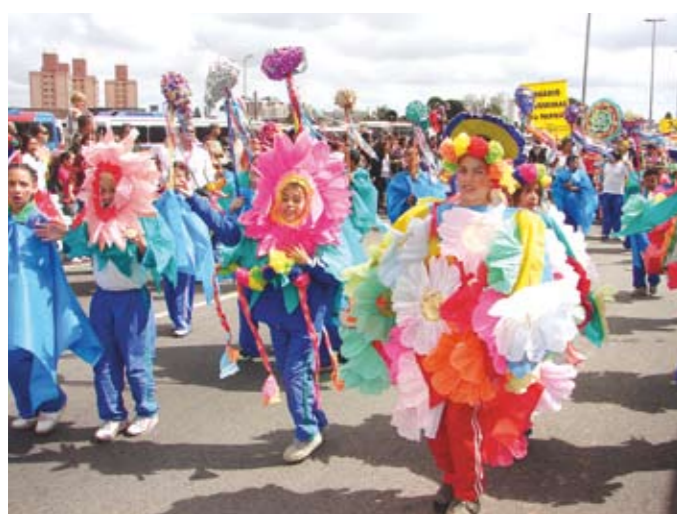
Desfile: 2.600 alunos de 14 escolas participaram da festa

As duas maiores paixões dos brasileiros, futebol e samba, foram a marca das comemorações dos 320 anos de Itaquera, em novembro. Os festejos começaram com um festival de futebol e terminaram com o desfile temático "Itaquera de ontem, Itaquera de hoje". Ao todo, 2.600 alunos de 14 escolas fizeram uma apresentação que contou a história e o desenvolvimento do bairro.