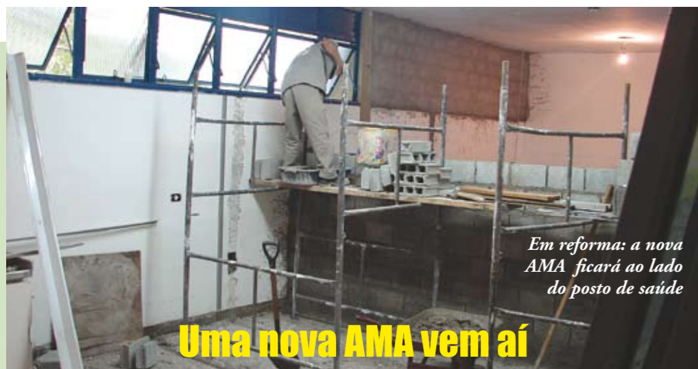
Em reforma: a nova AMA ficará ao lado do posto de saúde