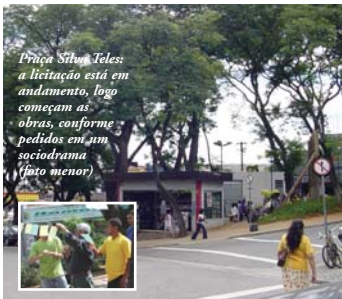
Praça Silva Teles: a licitação está em andamento, logo começam as obras, conforme pedidos em um sociodrama (foto menor)

Foram os próprios moradores que escolheram como será a reforma da nova praça Silva Teles. Em cinco sessões do projeto Sociodrama Público, foram feitos os pedidos, a praça terá posto policial, feira de artesanato, canteiros menores e passeios maiores, palco, lazer e cultura para crianças e idosos. Os tabuleiros nas mesas continuam. Os novos bancos serão mais confortáveis. Tudo como a população pediu.