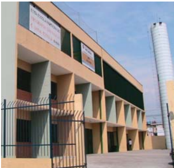
EMEF Dias Gomes: 500 novos alunos. Agora, são 1.300.

Quem estudava no EMEF Dias Gomes melhor decorar este endereço: rua Aléssio Prati 42, Jardim Bandeirantes. É o novo local da escola. O prédio, em alvenaria, substitui a antiga "escola de lata" da rua Jorge Neto Falcão, no Lajeado. Cerca de 500 alunos novos serão beneficiados com a entrega da construção, que está marcada para o dia 22 de setembro. Agora, será possível atender 1.300 crianças. Hoje, a escola conta com 12 salas de aula e funciona tanto pela manhã quanto à noite.