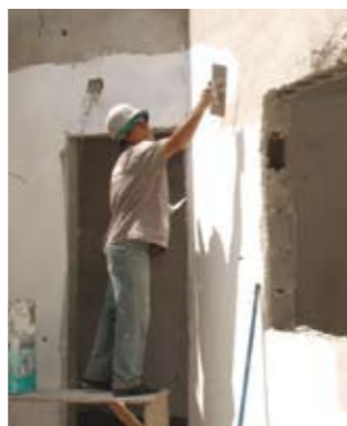
Posto Humaitá: em obras

Santa Cecília, serão 32 rampas nas ruas Veridiana, Jaguaribe, Marquês de Itú, Dr. Vila Nova e Major Sertório. Na alameda Gleite serão colocadas 12. Na avenida Angélica, 24 rampas. Na avenida Duque de Caxias, outras 11 rampas. Na avenida Higienópolis, 23 rampas. E na rua Pedroso, oito.