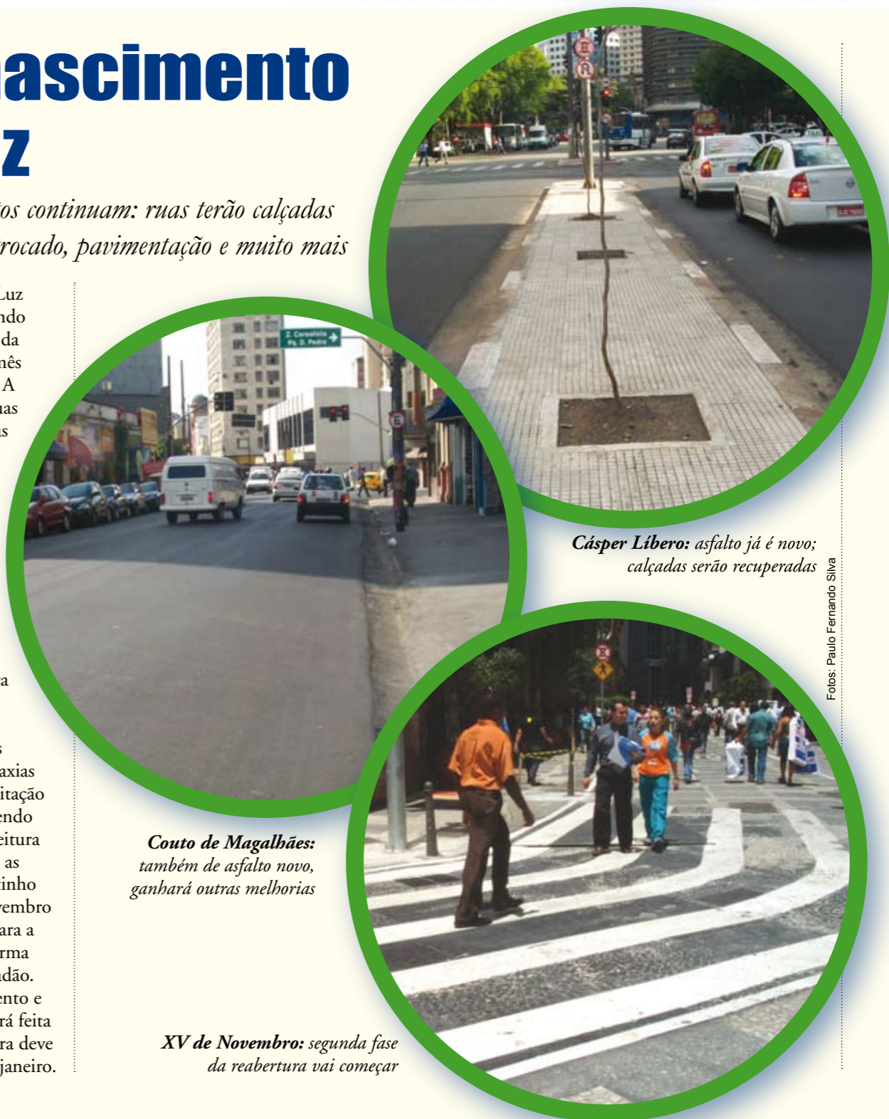
Cásper Líbero: asfalto já é novo; calçadas serão recuperadas

A região da Nova Luz continua recebendo atenção especial da Subprefeitura. Todo mês tem uma boa notícia. A mais recente: várias ruas passarão por melhorias como alargamento de calçadas, troca de pisos, redefinição da geometria da via, pavimentação, drenagem, troca de iluminação, instalação de fiação subterrânea e plantio de árvores. Entre essas ruas estão a Santa Ifigênia, a General Couto de Magalhães, a dos Protestantes e as avenidas Duque de Caxias e Cásper Líbero. A licitação para as obras já está sendo preparada. A Subprefeitura da Sé pretende iniciar as obras em janeiro. Pertinho dali, a rua XV de Novembro já está quase pronta para a segunda etapa da reforma para abertura do calçadão. Concluído o balizamento e a sinalização, agora será feita a pavimentação. A obra deve começar também em janeiro.