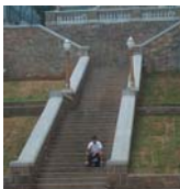
Novinha: a escadaria, restaurada

Acabou a restauração de um dos mais importantes monumentos do Bixiga: a escadaria que liga a rua 13 de Maio à rua dos Ingleses. A restauração, feita pela Subprefeitura e o Patrimônio Histórico, deixou a escadaria com aparência original, de 1929.