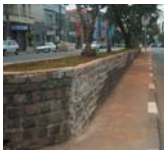
Rui Barbosa: canteiros cuidados

Está quase pronta a recuperação dos 500 metros de canteiros da avenida Rui Barbosa. Os paralelepípedos foram acertados e as jardineiras, consertadas. Agora falta regularizar o terreno dos canteiros e gramar a área. Ainda em setembro deve estar pratinho.