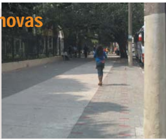
Piso recuperado: obra no parque da Luz já está pronta

O parque da Luz e a rua 7 de Abril estão com novas calçadas. No parque, foram recuperados 3.000 m 2 . O piso foi feito com blocos antiderrapantes, que facilita o escoamento da água. Já foi entregue. Na 7 de Abril, o piso está sendo recuperado. Grelhas serão instaladas nas canaletas de drenagem superficial. Termina em setembro.