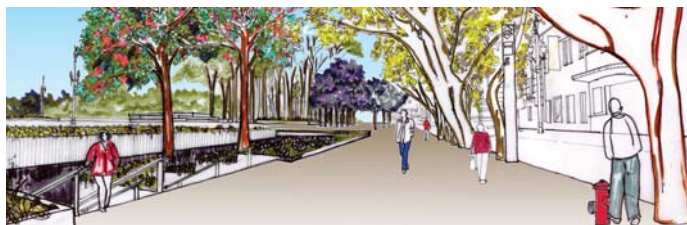
Praça da Sé: uma foto de como é hoje e, no desenho, como ficará

rodovias em direção ao interior do Estado –, será remodelada. Será dada especial atenção à iluminação, que será melhorada para aumentar a segurança. A reforma da Praça da República também será