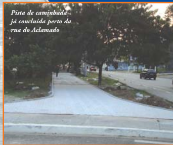
Pista de caminhada já concluída perto da rua do Aclamado