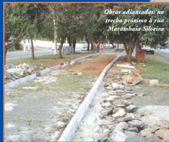
Obras adiantadas: no trecho próximo à rua Marambaia Silveira