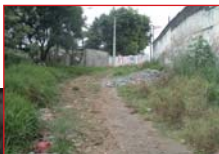
Antes e depois: a praça Sérgio Tallans (esquerda) já mudou

Jardim das Pedras, Recanto Cocaia, Jardim Arco Iris e Jardim Eliana. Até o final do ano, haverá outra fase, mais 100 ruas. A região vinha recebendo intervenções paliativas, como cascalhamento e regularização. Agora, as obras são definitivas e beneficiam quase 3 mil famílias que vivem em Chácara Cocaia.