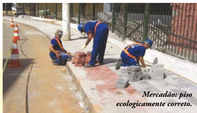
Mercadão: piso ecologicamente correto.

de piso intertravado já foram instalados na Vila Formosa