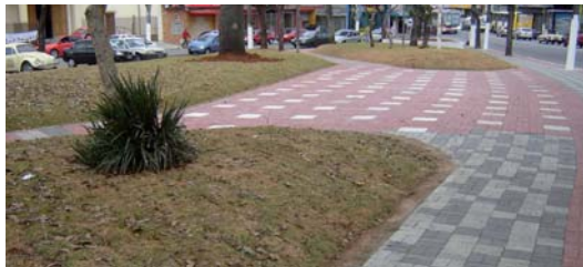
Praça Nossa Senhora das Vitóriaas: novo gramado e piso intertravado.