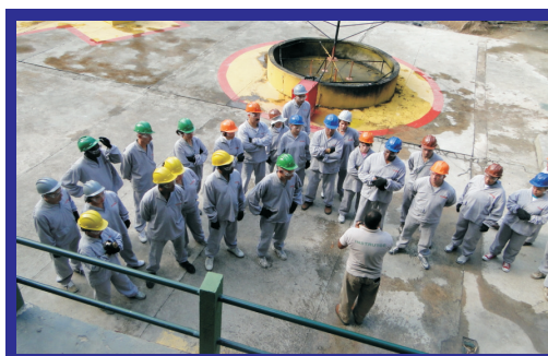
Profissionais da saúde, paramentados participam do 4º Treinamento de Combate a Incêndio e Primeiros Socorros do HSPM.

importância da integração dos grupos voltados para o desenvolvimento das orientações teóricas e práticas. O conteúdo programático, contemplou um dia de treinamento para cada grupo que se dividiram em aproximadamente trinta funcionários, podendo assim, conceberem orientações de primeiros socorros, tais como: forma correta de estabilização da cabeça da vítima, avaliação primária e secundária, estímulos motor; verbal e ocular, parada respiratória, parada cardíaca, reanimação cardíaco-pulmonar, obstrução