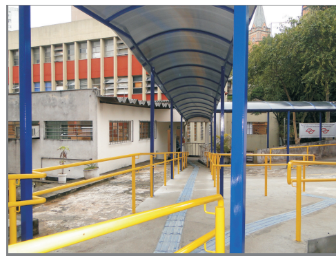
Instalação de cobertura no "corredor" para a GESST

Além disso, já foi concluída a instalação de cobertura (toldos) no "corredor" para AMED, DESAT, GESST e Segurança do Trabalho. ■