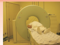
Sala de tomografia - 3º andar

O CDI (Centro de Diagnóstico por Imagem e Traçados) atende os pacientes internados e os encaminhados do Ambulatório e dos Serviços de Urgência. São realizados os seguintes exames: Raio-x Simples e Contrastado; Tomografia; Angiografia; Mamografia; Ultrassonografia; Eletromiografia; Eletroencefalograma e Endoscopia.