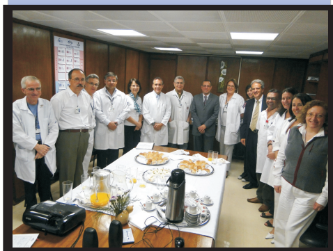
Superintendência e Direção da Unidade Hospitalar em recepção