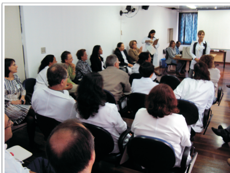
Ao final do curso, formaram-se 33 profissionais da Unidade Hospitalar

No último dia (16), no 7º andar do prédio administrativo do HSPM, foi realizada a entrega de certificados para os formandos da 1ª turma do "Curso de Capacitação Saúde Baseada em Evidências". Esta é uma parceria entre o HSPM e o Instituto de Ensino e Pesquisa do Hospital Sírio Libanês (EP/HSL) e ANVISA.