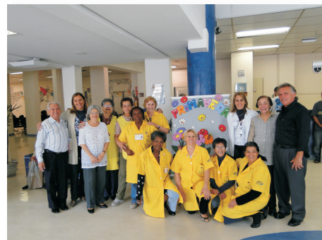
Músicos e voluntários da CAV participam do evento.