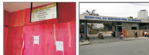
As obras da Clínica de Odontologia (3º andar) e a nova portaria estão a todo vapor