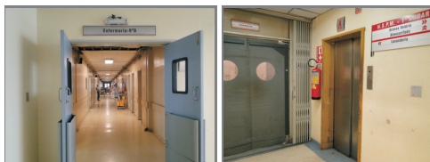
Fechamento da Enfermaria do 9º andar (Ala B) e início da reforma na Lavanderia no térreo