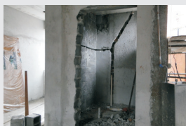
Sanitário de deficientes - nova recepção