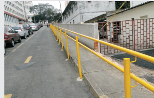
Instalação de Corrimãos - imagem da rampa de acesso aos ambulatórios