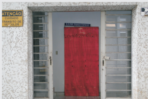
Instalação de elevador - imagem entrada do espaço cultural