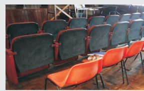
Cadeiras de obesos - imagem do Anfiteatro 9º andar