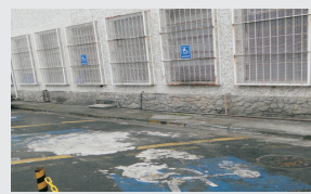
Sinalização e demarcação de vagas especiais no estacionamento