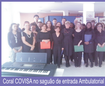
Coral COVISA no saguão de entrada Ambulatorial