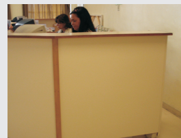
Adaptação de balcões - imagem do 5º andar do Hospital