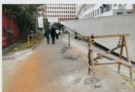
Piso tátil acesso ao saguão ambulatorial