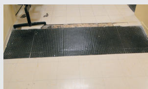
Redução de inclinação de rampas 2º Serviço Social Médico