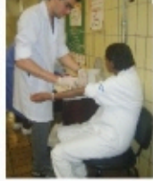
Voluntário da AMEO