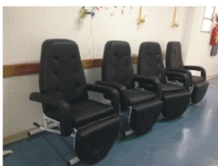
Algumas das cadeiras no PSI

O Hospital Dr. José Soares Hungria recebeu no mês passado 120 cadeiras, que propiciarão mais conforto para nossos pacientes e acompanhantes.