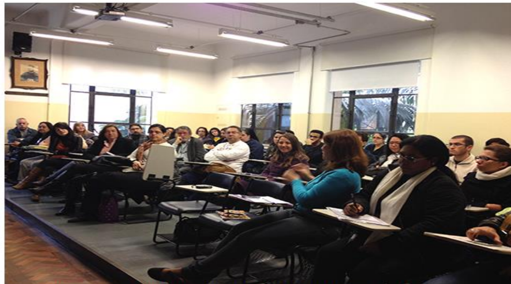
Entrevistadores passam por treinamento para o Inquérito Domiciliar de Saúde 2014

Mais de 4.000 entrevistados responderão, entre outras, a perguntas relativas a doenças, práticas saudáveis e utilização de serviços de saúde