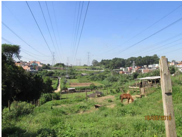
Foto 15: Vista geral do Hortifrutigranjeiro instalado como comodato na faixa de segurança da LTA Henry Borden.