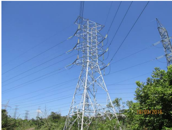
Foto 03: Torre da LTA Henry Borden que será substituída no local.