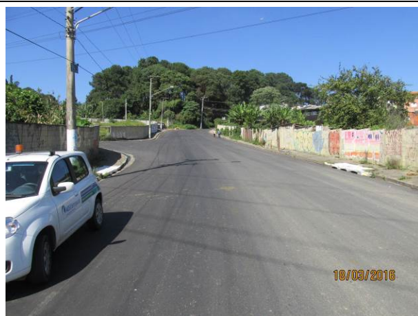
Foto 24: Trecho da Rua Pinheiro Furtado que cruza a LTA Henry Borden.