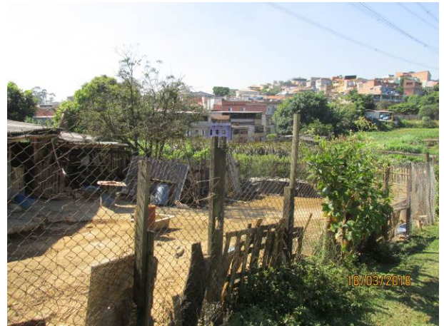
Foto 16: Detalhe do hortifrutigranjeiro instalado como comodato na faixa de segurança da LTA Henry Borden.