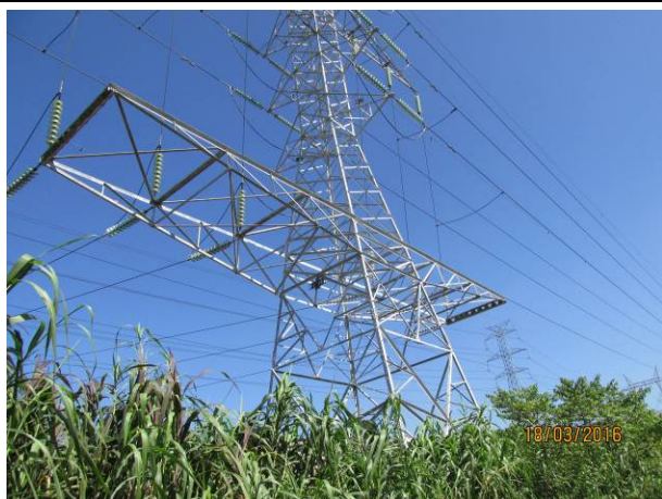
Foto 21: Detalhe da torre que será substituída pela novas torres metálicas na reforma das LTA Henry Borden.