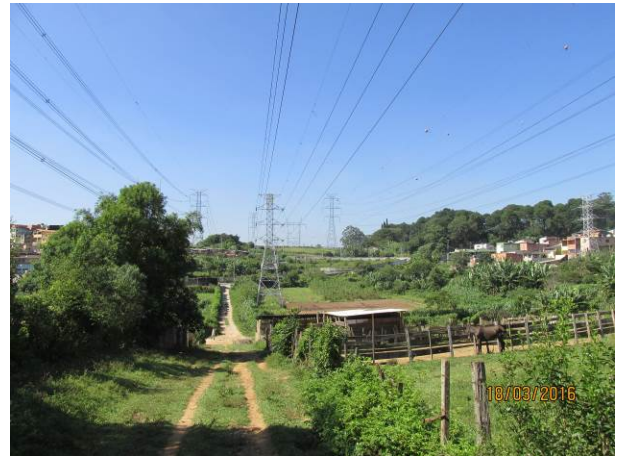
Foto 14: Acesso de terra que será utilizado na reforma da LTA Henry Borden.