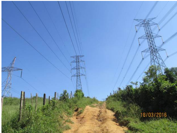
Foto 13: Acesso de terra que será utilizado na reforma da LTA Henry Borden.