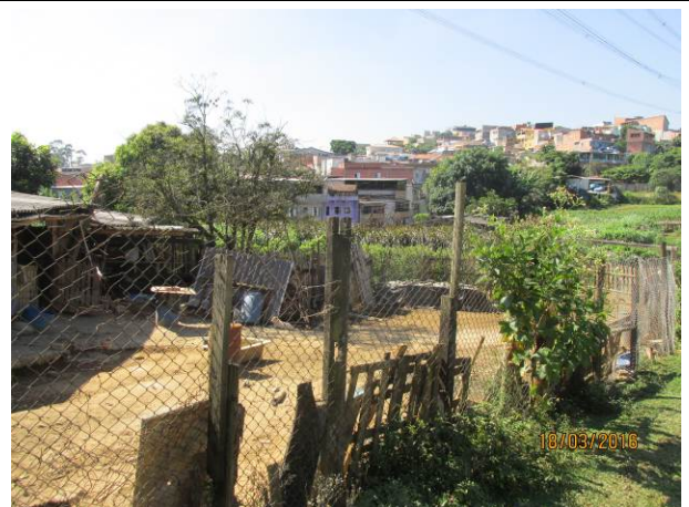
Foto 18: Detalhe do hortifrutigranjeiro instalado como comodato na faixa de segurança da LTA Henry Borden.