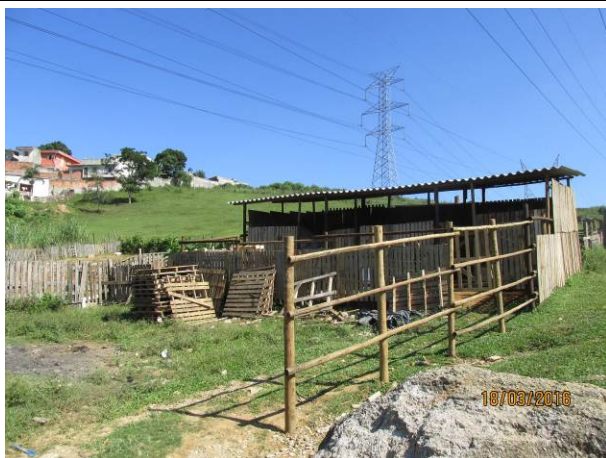
Foto 17: Detalhe do hortifrutigranjeiro instalado como comodato na faixa de segurança da LTA Henry Borden.