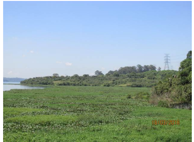
Foto 02: Detalhe da área de várzea da represa cruzada pela linha de transmissão.