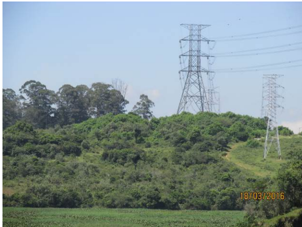
Foto 01: Vista geral da LTA Henry Borden no trecho onde será executada a reforma parcial da linha.