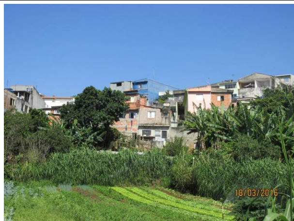
Foto 20: Detalhe do hortifrutigranjeiro instalado como comodato na faixa de segurança da LTA Henry Borden.