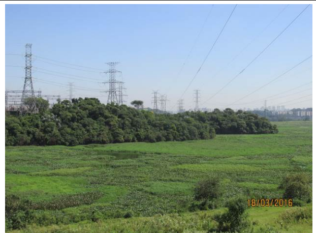
Foto 06: Detalhe da área de várzea cruzada pela LTA Henry Borden.