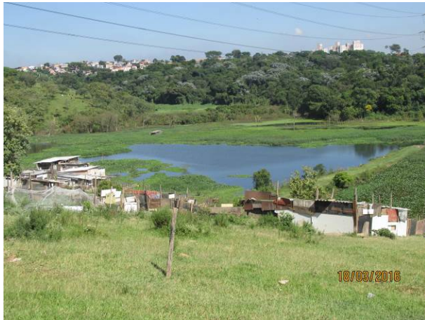
Foto 07: Ocupação irregular localizada na faixa de segurança da LTA Henry Borden.