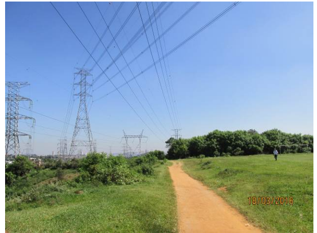
Foto 10: Acesso de terra que será utilizado na reforma da LTA Henry Borden.