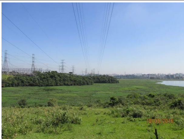
Foto 05: Visada do eixo da LTA Henry Borden no trecho onde será realizada a reforma da linha.