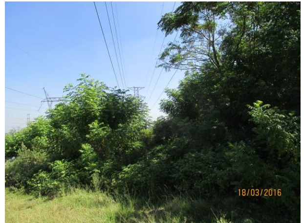
Foto 08: Detalhe do fragmento florestal em estágio inicial que é interceptado pela LTA Henry Borden.