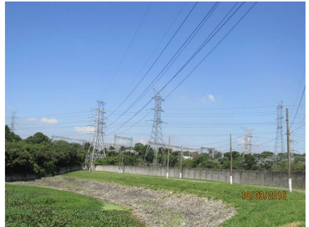
Foto 04: Detalhe da LTA Henry Borden no trecho que será reformado.