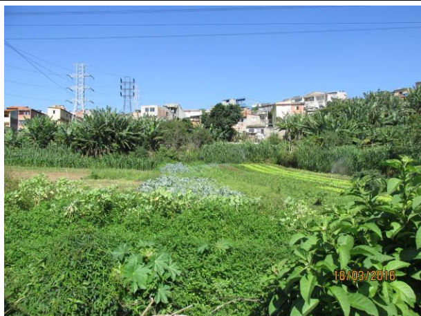
Foto 19: Detalhe do hortifrutigranjeiro instalado como comodato na faixa de segurança da LTA Henry Borden.