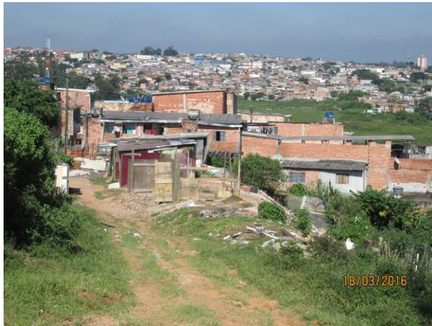
Foto 09: Detalhe das ocupações irregulares na faixa de segurança da LTA Henry Borden.