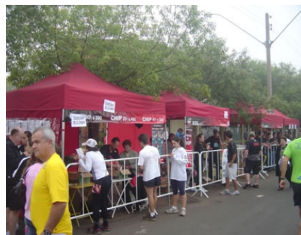
Exemplos de Arena de Concentração em Corridas de Rua