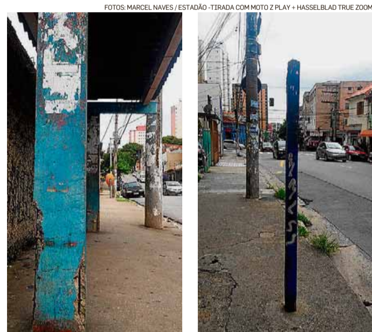
Ônibus. A Blitz da Rádio Estádio constatou ontem falta de manutenção em pontos da Casa Verde, zona norte da capital, que datam dos anos 1990. A Prefeitura prometeu vistoria.

ESTÁ COM PROBLEMAS EM SEU BAIRRO? MANDE PARA NÓS PELO WHATSAPP 11-9-9481-1777. SINTONIZE FM 92.9 OU OUÇA PELA WEB NO ENDEREÇO DA RÁDIO ESTÁDIO (RADIO.ESTADAO.COM.BR/PLAYER). TAMBÉM OUÇA PELO APLICATIVO DA RÁDIO PARA ANDROID E IOS