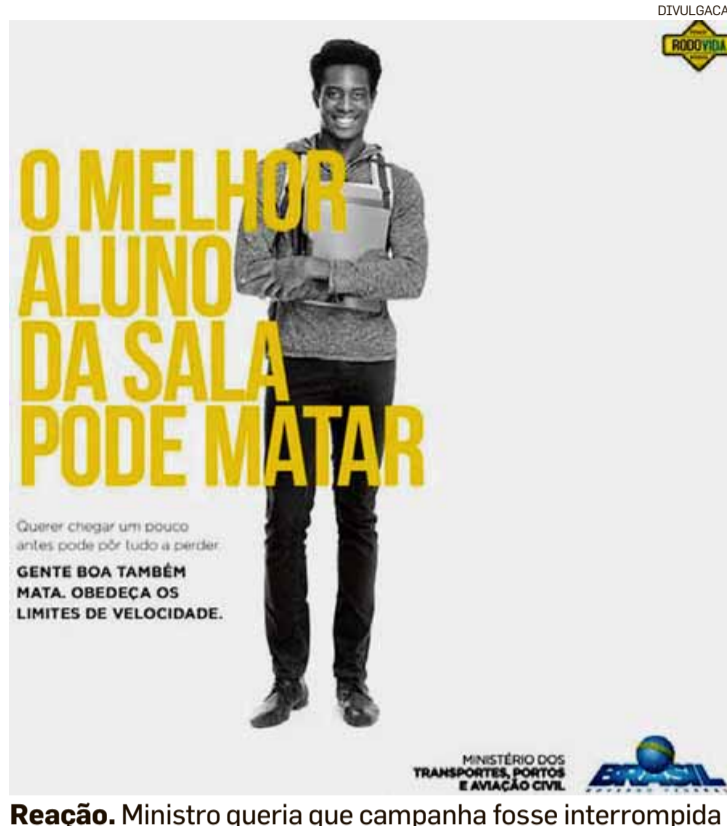
Reação. Ministro queria que campanha fosse interrompida

portagem, o ministro dos Transportes, Maurício Quintella Lessa, destaca que a campanha não foi idealizada pela pasta e cita também como um dos maiores problemas as imagens inseridas no material impresso.