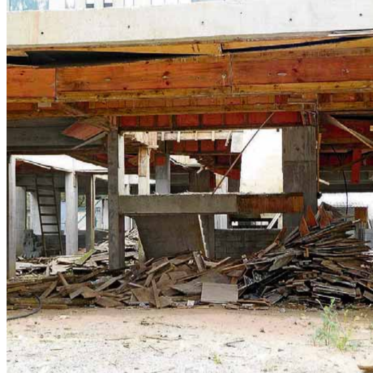
Saúde. A Blitz da Rádio Estádio esteve ontem na Rua Dr. Diogo de Faria, 609, Vila Clementino, zona sul. Moradores reclamam da paralisação das obras da UPA Vila Mariana. A Prefeitura analisa eventual retomada dos trabalhos.