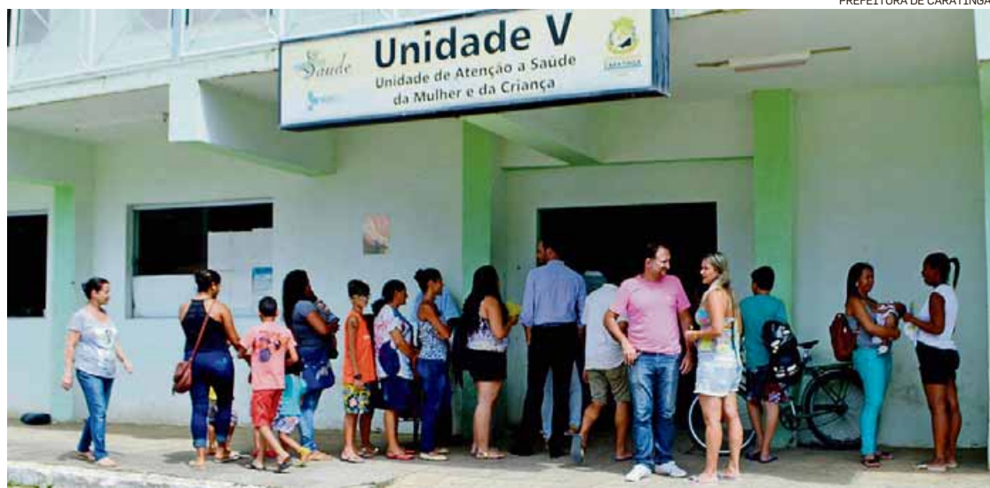
Procura. Moradores fazem fila em unidade de saúde em Caratinga, no interior do Estado

sidade de moradores de área de risco terem vacinas em dia.