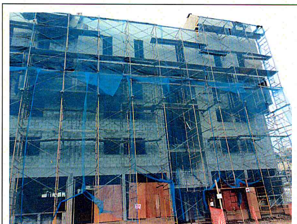
FOTO 1 – Área 150 - Pq Novo Santo Amaro V - Luz Soriano - Unidades Habitacionais