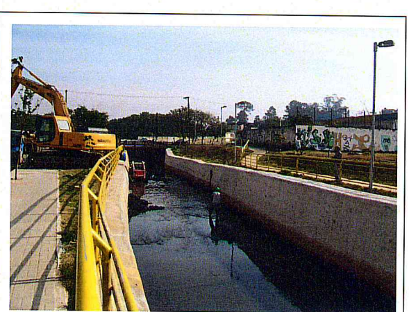
FOTO 6 – Área 213 - Ribeirão das Pedras - Rua Virginia Maria da Conceição