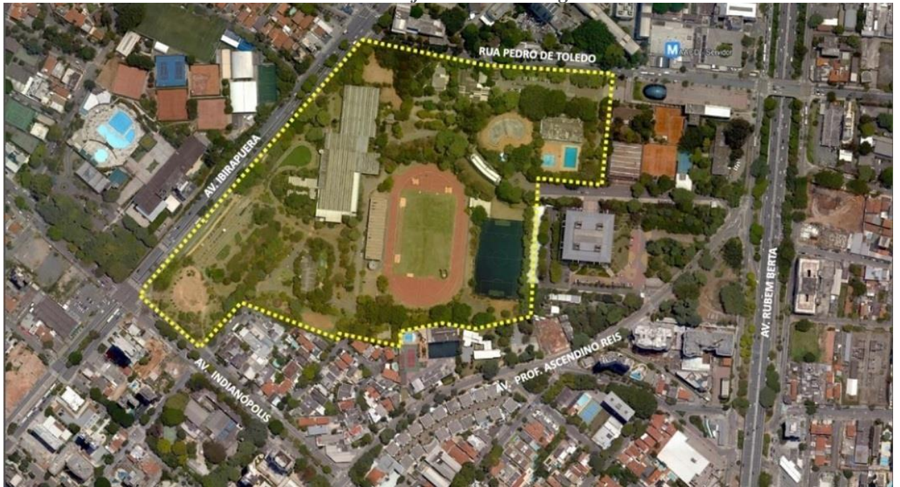
Figura 1 – Localização Complexo SEME