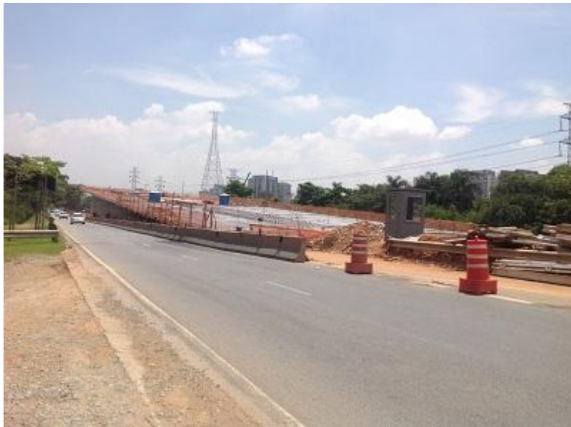
PONTES LAGUNA E ITAPAIÚNA: Obras em andamento Canteiro e estruturas (pilar e rampas)