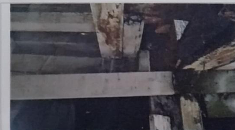
13 – Viga de sustentação de um dos domicílios com pontos de podridão.