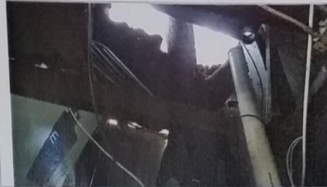
03 – Cobertura da Viela 14 quebrada.

PROGRAMA: URBANIZAÇÃO E REGULARIZAÇÃO DE ASSENTAMENTOS PRECÁRIOS