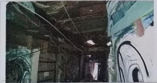
04 – Viela 14 sem iluminação natural.