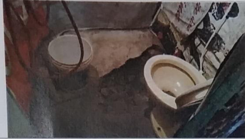
15 – Banheiro do selo 01/0125 A.