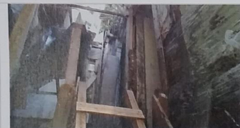
11 – Domicílio com madeiras podres.