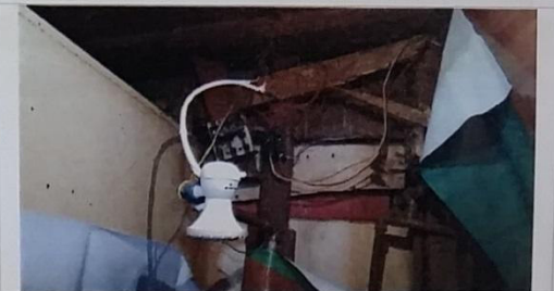
20 – Fiação aparente risco de curto circuito.