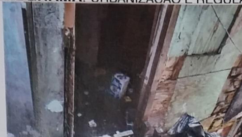
09 – Domicílio com madeiras podres.