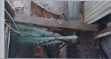
23 – Selo 01/0114 A esta com o piso cedendo.