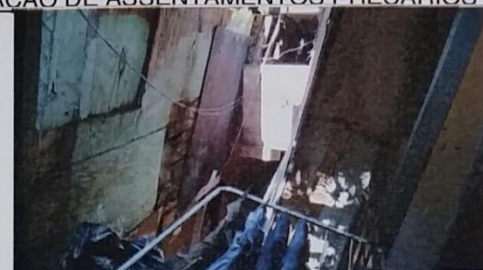
10 – Único ponto de luz natural na VIELA 14.