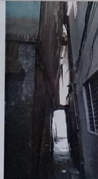
25 – 01/0048 A está cedendo.