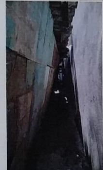
26 – 01/0053 A está cedendo.