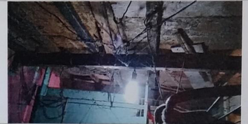
18 – Fiação aparente risco de curto circuito.