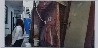
24 – 01/0048 A está cedendo.