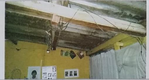
16 – Fiação exposta.