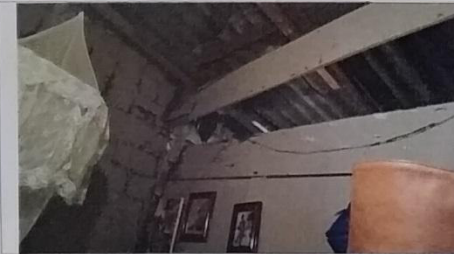
07 – Viga de sustentação do telhado podre.