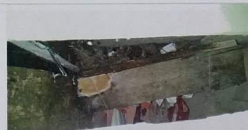
12 – Viga de sustentação de um dos domicílios com pontos de podridão.