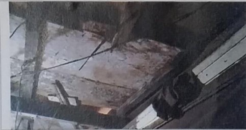
17 – Teto do selo 01/0125 A podre.