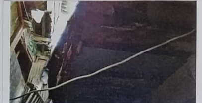
22 – Domicilio com todo o seu madeiramento podre.