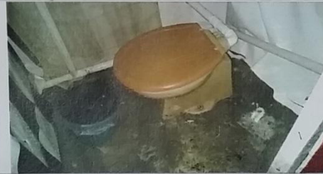
05 – Banheiro do selo 01/0124 A.