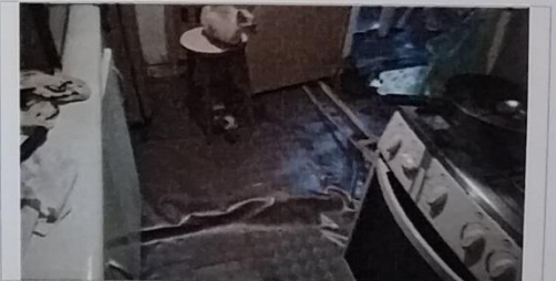
08 – Selo 01/0123 A piso de madeira podre