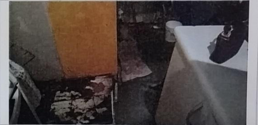
06 – Selo 01/0124 A piso de madeira podre.