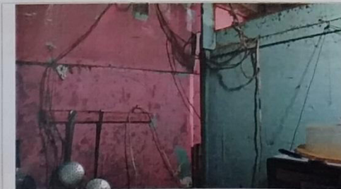
19 – Fiação próximo ao fogão.