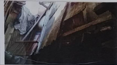
21 – Domicilio com todo o seu madeiramento podre.