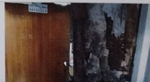
14 – Selo 01/0122 A com paredes de madeira podre.