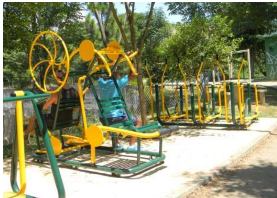
Imagens do local