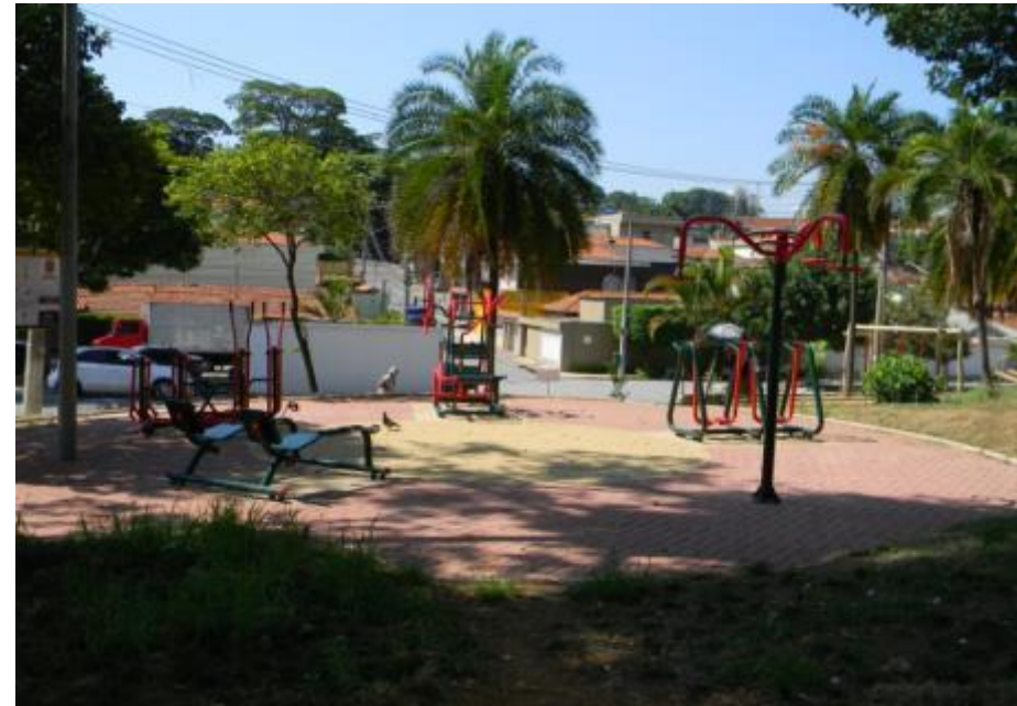
Imagens do local