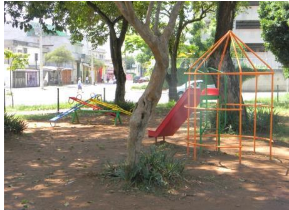
Imagens do local