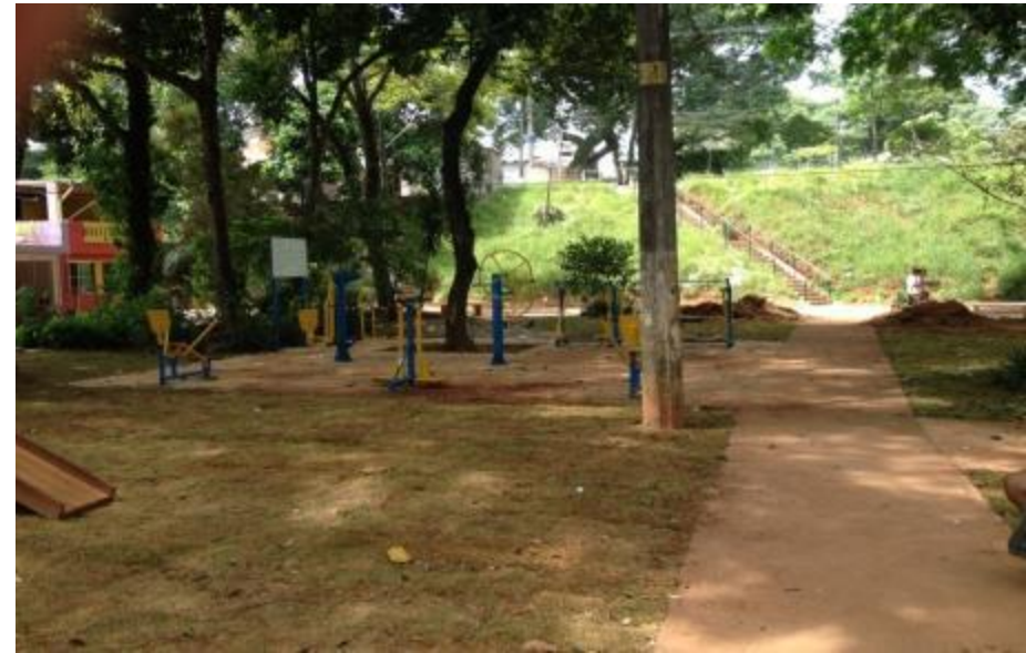
Imagens do local