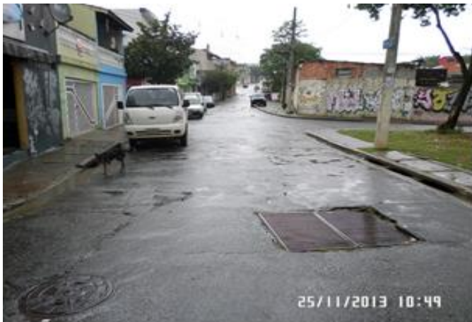
Rua Coatimirim (Penha): Vista da área antes do início das obras – 25/11/2013