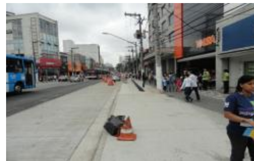
17/11/14 - Av. Adolfo Pinheiro, 63