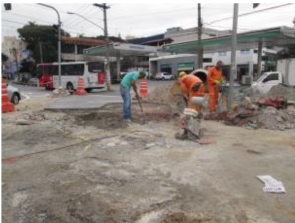
Recuperação do passeio na ilha da Rua São Teodoro - antes