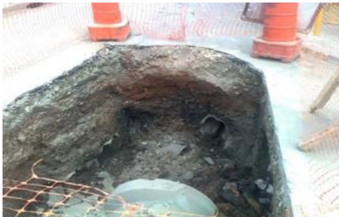
Rua Marcondes Buarque (Jaçanã / Tremembé): Demolição e escavação do PV existente – 18/11/2014