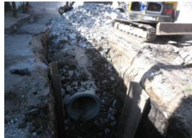
Rua Paulino Arena (Jaçanã / Tremembé): Execução da rede de drenagem – 12/11/14