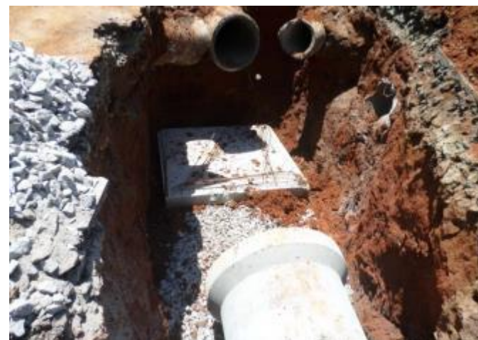
Rua Almir Alves de Souza: Laje de fundo do PV 18 na Rua Alfaró – 21/11/2014