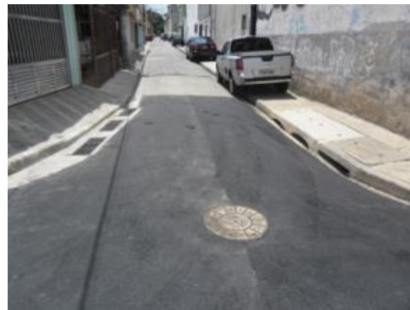
Vista da Travessa Leandro Ferreira – VI. Maria / VI. Guilherme – 12/02/14