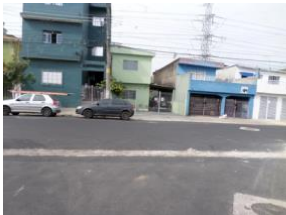
Sarjetão na R. Augusto Montenegro – Jaçanã / Tremembé - 21/11/14