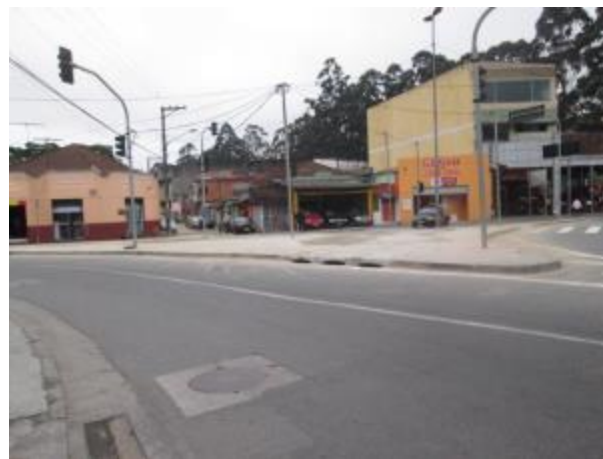
Recuperação do passeio na ilha da Rua São Teodoro - depois