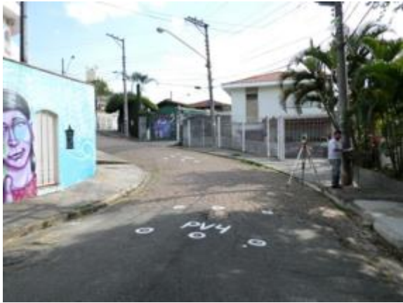
Rua Jardimirim (Santana / Tucuruvi) - Antes 11/10/13