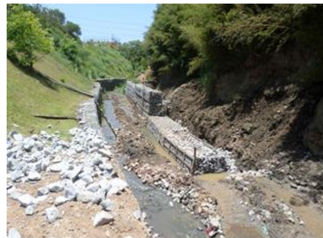
Av. Cipriano Rodrigues (depois): Execução de gabião margem direita – 21/11/2014