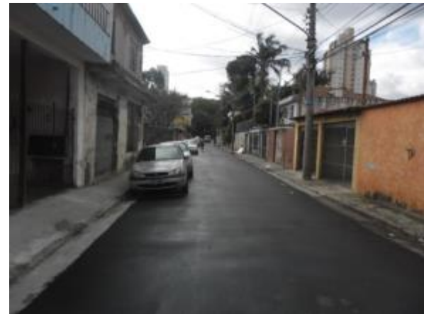
Rua Jardinésia (Santana / Tucuruvi) – Depois 04/09/14