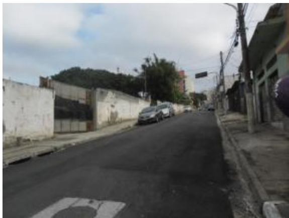
Rua João Delgado - Freguesia do Ó / Brasilândia – 15/08/14