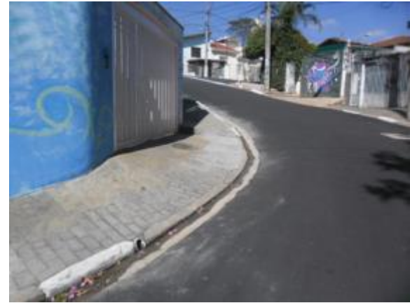
Rua Jardimirim (Santana / Tucuruvi) - Depois 16/05/14