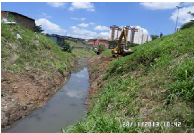
Av. Cipriano Rodrigues: Vista geral antes do início das obras 05/11/2014