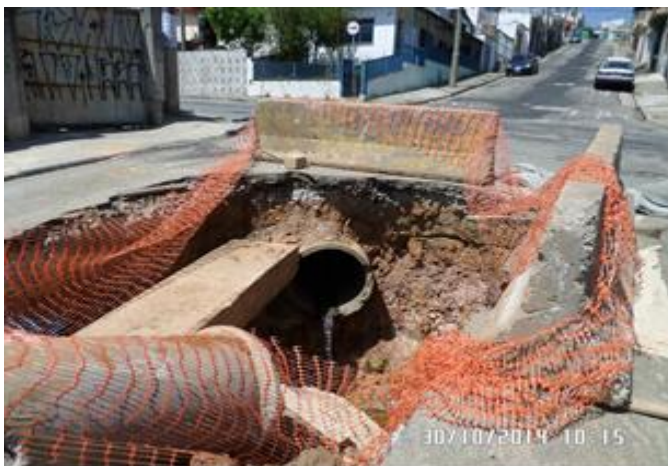
Travessia a ser executada entre a Rua Pierrotinho e a Rua Hamilton Prado – 30/10/2014