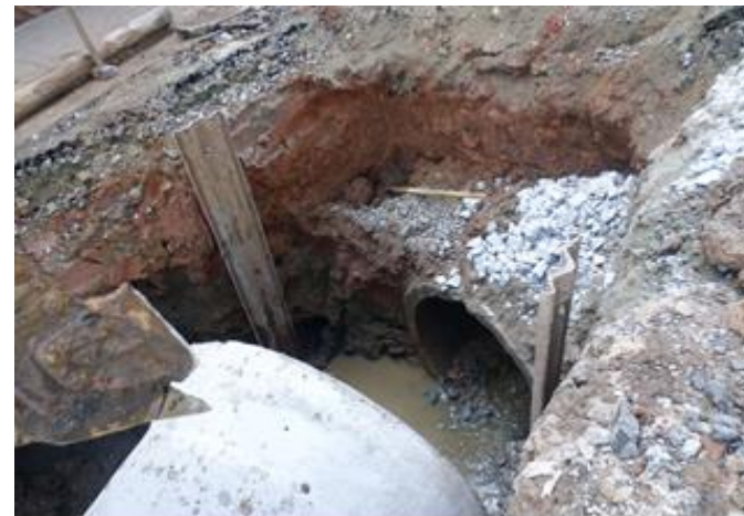
Assentamento de tubo do tubo do PV 23 ao PV 22 na Rua Brejo Novo – 21/11/2014