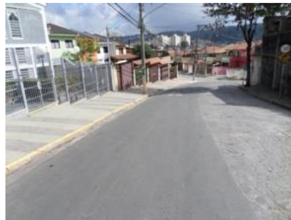
Rua Raulino Galdino da Silva - Freguesia do Ó/Brasilândia – 02/06/14