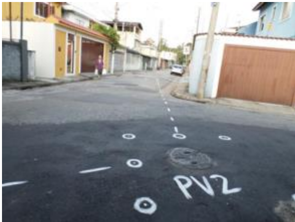
Rua Jardinésia (Santana / Tucuruvi) – antes 10/10/13