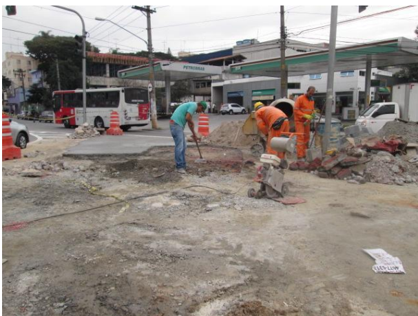
Recuperação do passeio na ilha da Rua São Teodoro - antes