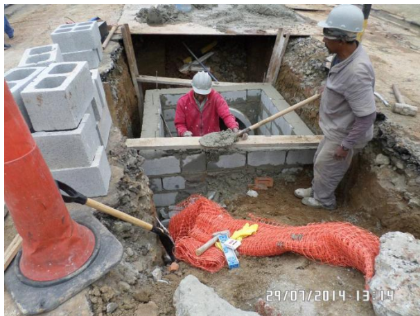
Rua Coatimirim (Penha): Execução do PV 09