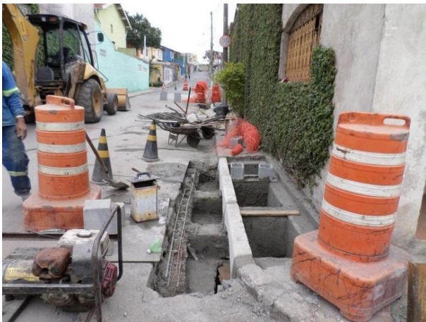
Rua Marcondes Buarque (Jaçanã / Tremembé): Execução de boca de leão e boca de lobo