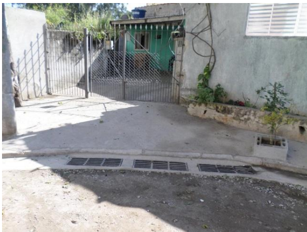
Execução de boca de leão na Rua Diogo Tinoco