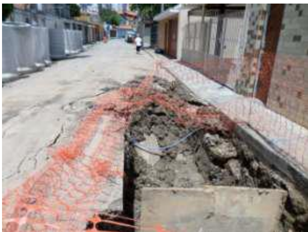
Rua Jardinésia (Santana / Tucuruvi) - antes