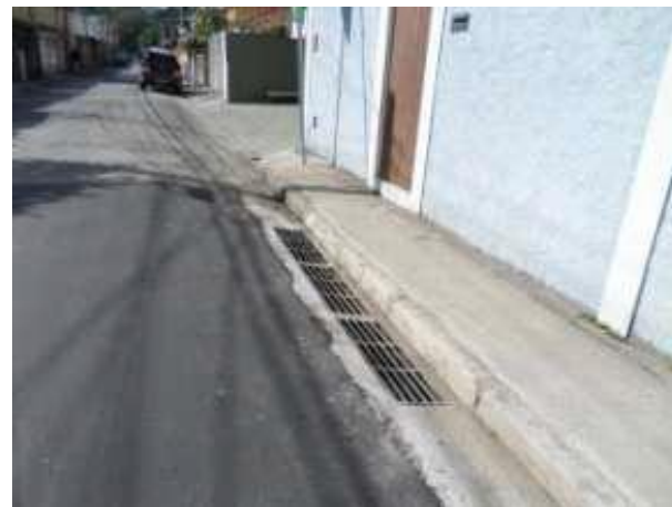
Rua Jardinésia (Santana / Tucuruvi) - Depois