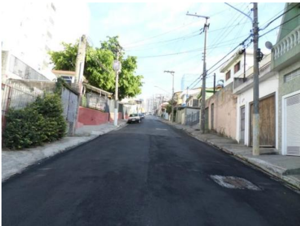
Rua João Delgado - Freguesia do Ó / Brasilândia