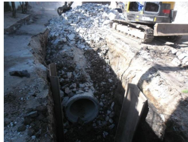
Rua Paulino Arena (Jaçanã / Tremembé): Execução da rede de drenagem