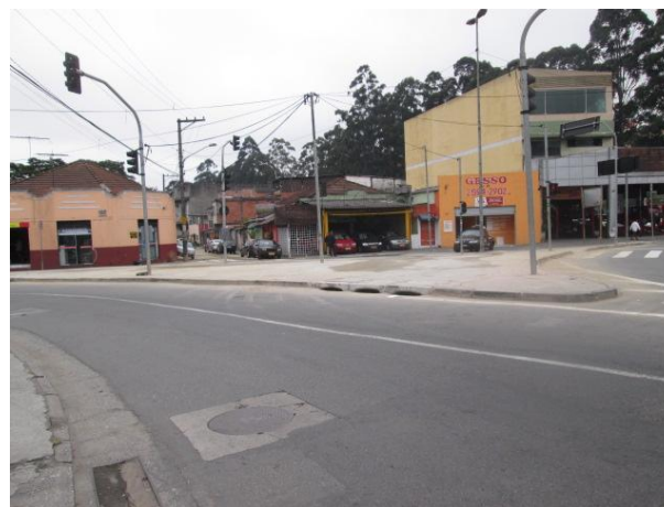
Recuperação do passeio na ilha da Rua São Teodoro - depois