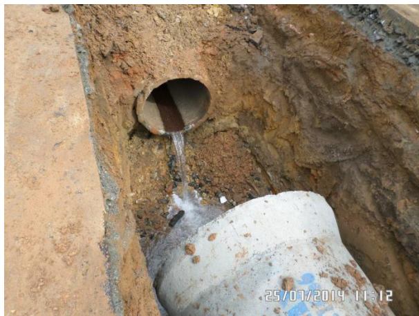
Rua Pierrotinho (Aricanduva / VI. Formosa): Implantação da rede de drenagem