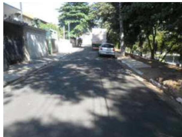
Rua Jardimirim (Santana / Tucuruvi) - Depois