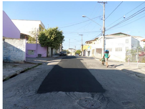
Rua Raulino Galdino da Silva - Freguesia do Ó/Brasilândia