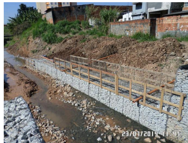
Av. Cipriano Rodrigues: Execução do gabião na margem direita do córrego Ipiranguinha