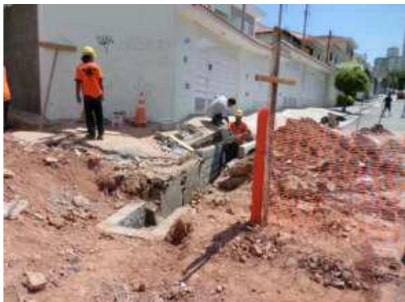
Travessa Neco - Santana/Tucuruvi - antes