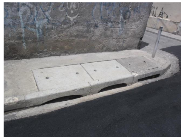
Vista da Traversa Leandro Ferreira – Vl. Maria / Vl. Guilherme