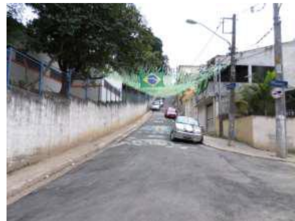
Travessa Neco - Santana/Tucuruvi - depois