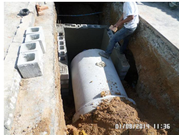
Rua Almir Alves de Souza (Aricanduva / VI. Formosa): Execução do PV