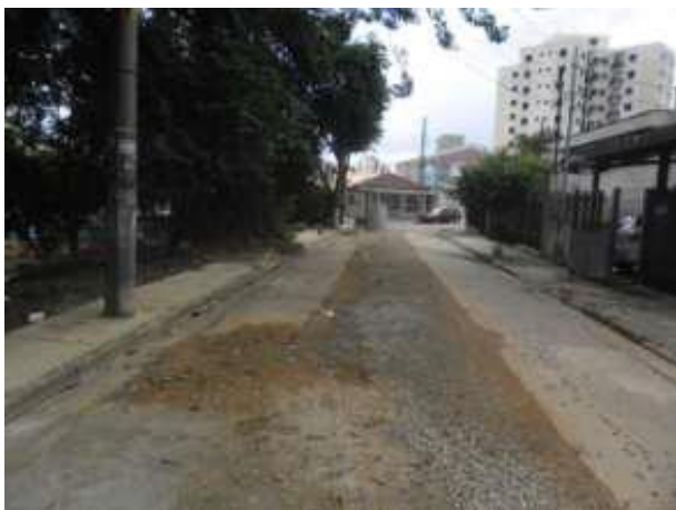
Rua Jardimirim (Santana / Tucuruvi) - Antes