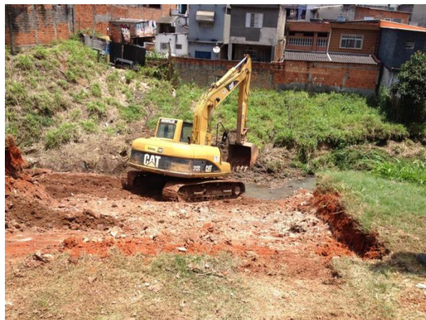
Av. Cipriano Rodrigues: Início da limpeza vegetal