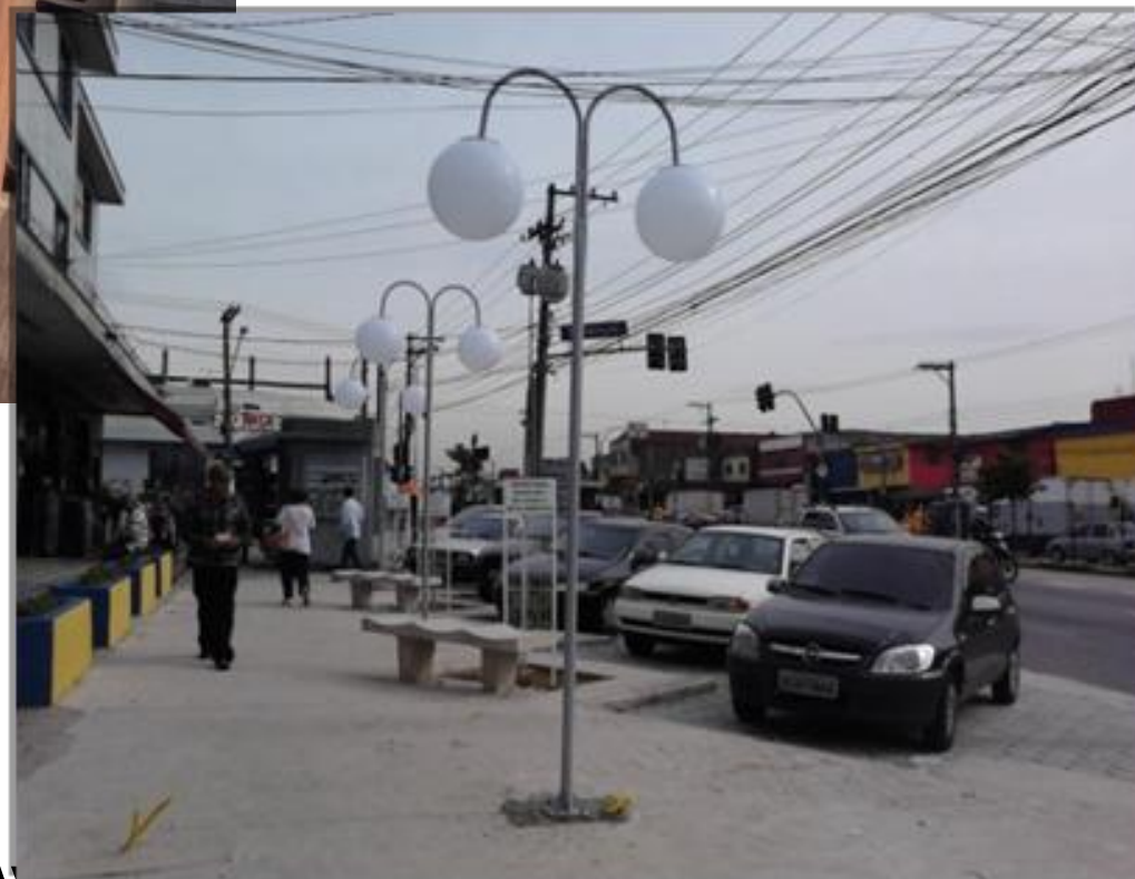
Av. Cupece SP / Cidade Adhemar