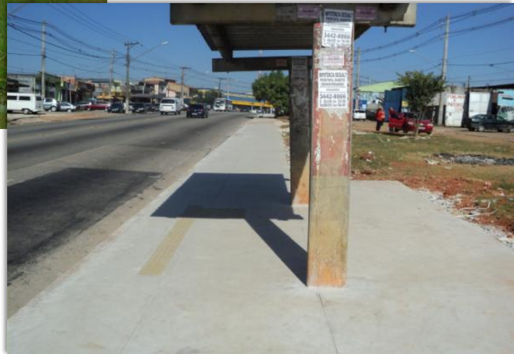
Av. Sapopemba SP / São Mateus