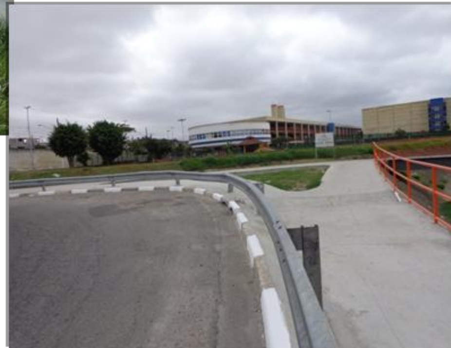
Entorno do CEU Jambeiro SP / Guaianases