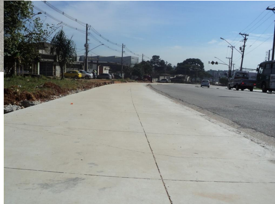
Av. Sapopemba SP / São Mateus