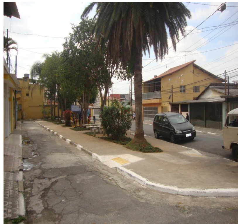
Imagens do local