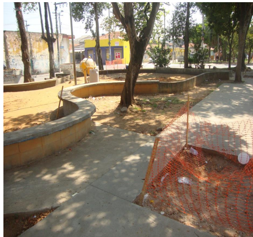
Imagens do local