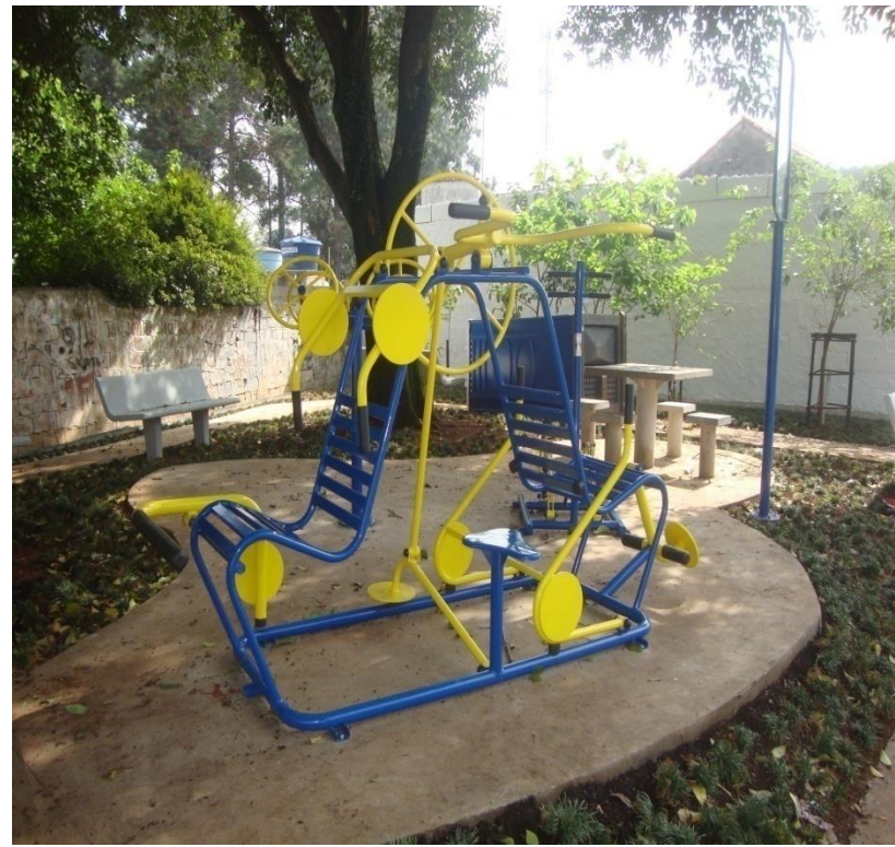
Imagens do local