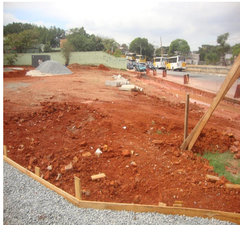
Imagens do local