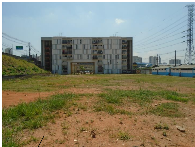
CONDOMÍNIO B (221 UHS)

EM OBRAS INÍCIO DAS OBRAS DE EXECUÇÃO DAS UNIDADES HABITACIONAIS