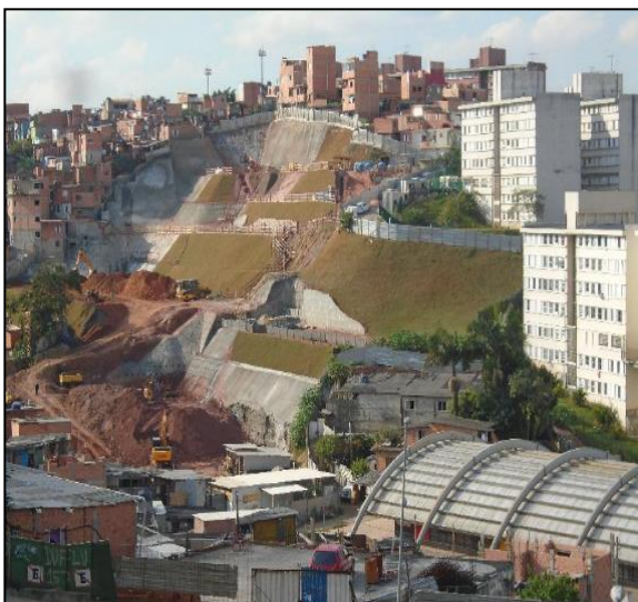
CONDOMÍNIO M (50 UHS)