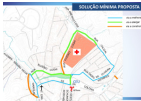
Entorno Hosp. Parelheiros