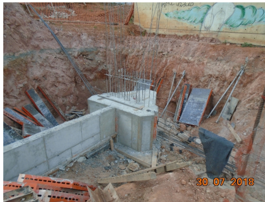
Retirada de forma do bloco e viga de travamento