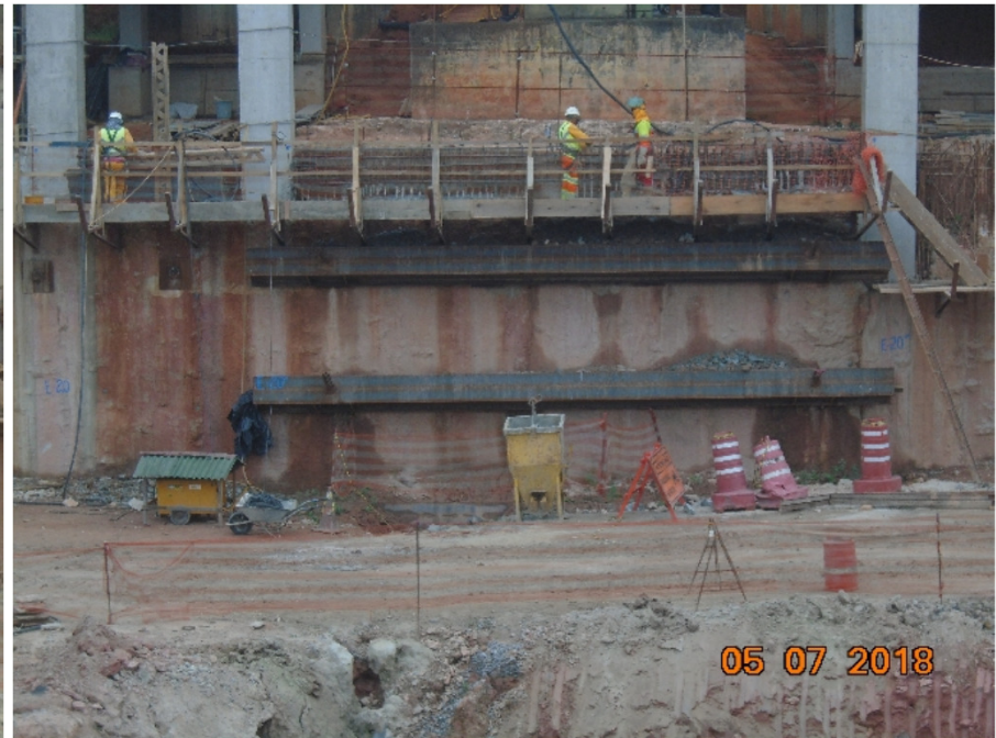
Vista do andaime para construção da viga de coroamento