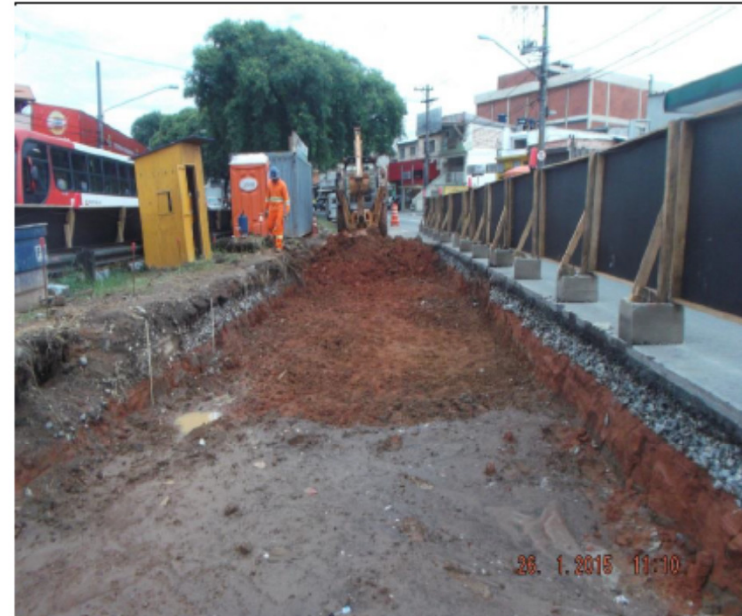
Abertura da caixa e escavação para construção da faixa do Corredor de Ônibus.