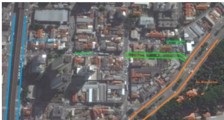
Duplicação Rua Darzan