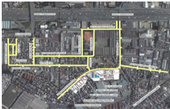
Entorno CEU Novo Mundo