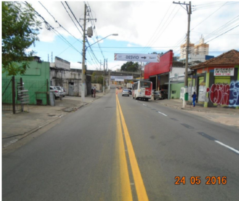
Av. Itaquera antes da reconstrução.