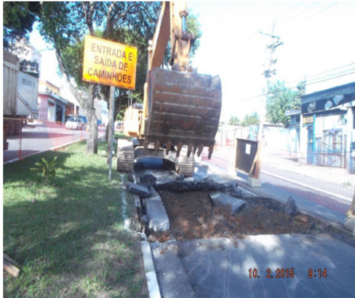
Demolição de pavimento flexível (asfalto) para abertura da caixa de construção da faixa do Corredor de Ônibus.