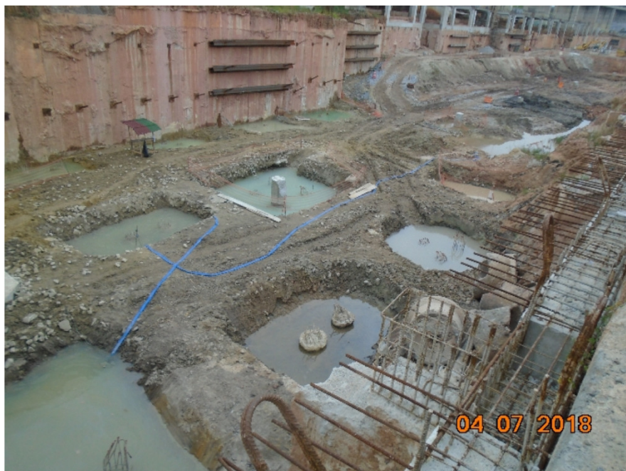
Vista do bombeamento de água na área de escavação do terminal