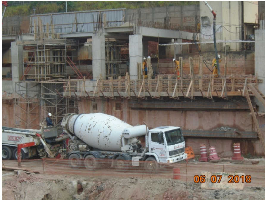
Lançamento de concreto para construção da viga de coroamento