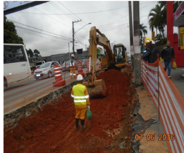
Início da demolição para construção da faixa do corredor de Ônibus.