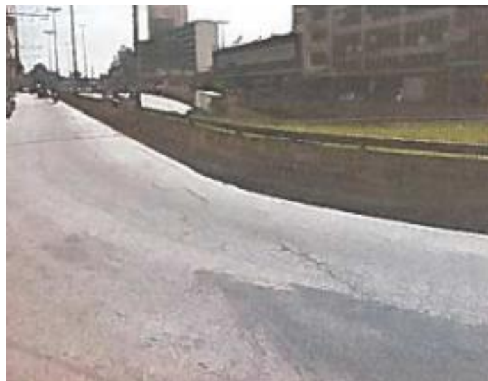
Fotos do local