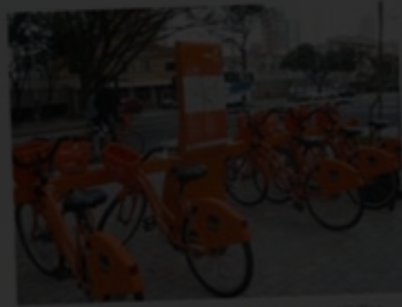
Estação Cinemateca, em São Paulo, disponibiliza empréstimo de bicicletas

Cartão que é usado para o Metrô servirá também para o desbloqueio das bicicletas, depois do cadastro do usuário no site do Bike Sampa . O pagamento, porém, segue sendo feito por meio de cartão de crédito e não haverá cobrança pelo próprio Bilhete Único.