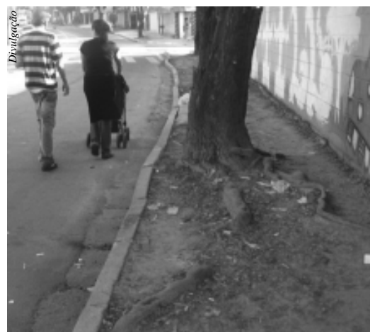
As raízes da árvore impedem que a mãe com o bebê transitem pela calçada

pois a água fica acumulada entre as guias e o muro da escola. É frequente ver crianças e idosos tropeçando nas raízes das árvores plantadas na referida calçada.