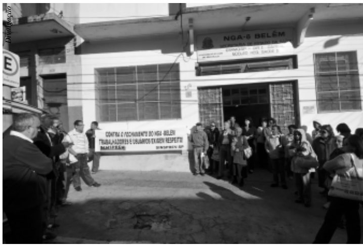
Funcionários e pacientes fazem protesto contra a desativação do Centro de Especialidades Belém

Há um mês, pacientes e funcionários do Centro de Especialidades Belém convivem com a ameaça de fechamento. No dia 28 de maio o Governo do Estado anunciou a desativação do NGA (Núcleo de Gestão Ambulatorial), que funciona há 30 anos na Rua Dr. Clementino, nº 200, e a transferência dos 45 mil pacientes com prontuários ativos para outra unidade, a AME (Assistência Médica de Especialidades) Maria Zélia. Inicialmente, a data de fechamento estava agendada para 17 de junho, mas o Ministério Público foi acionado e o prazo adiado para 2 de agosto. No dia 23, representantes dos 100 servidores e alguns pacientes participaram da reunião da Comissão de Saúde da Câmara Municipal, quando foram deliberadas algumas ações dos parlamentares na tentativa de impedir o fechamento do núcleo. O centro dispõe de dez especialidades: cardiologia, dermatologia, endocrinologia, gastroenterologia, ortopedia, otorrinolaringologia, pneumologia, reumatologia, urologia e cirurgia plástica reparadora. Essas especialidades atraem pacientes até de outros estados. A média mensal de atendimentos é de 3 mil pessoas, encaminhados por Unidades Básicas de Saúde (UBSs) e Assistências Médicas Ambulatoriais (AMAs). Pacientes temem mudanças de médicos, com quem se tratam há anos, e deslocamentos até o equipamento indicado. A unidade fica perto da estação Belém do metrô, enquanto a AME Maria Zélia está localizada a três quilômetros e perto da Marginal do Tietê, com acesso mais difícil.