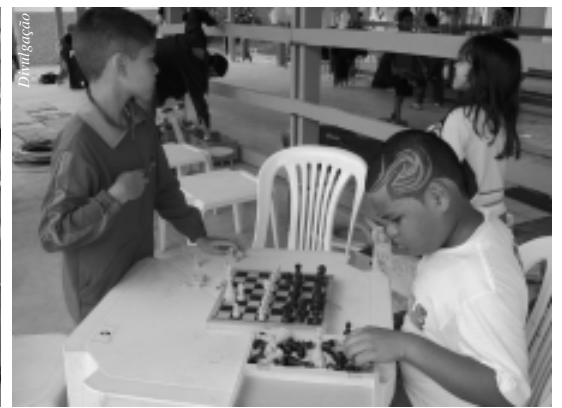
No ano passado o evento foi um sucesso

As férias estão chegando e o programa Super Férias, iniciativa da Secretaria Municipal de Esportes, Lazer e Recreação traz uma série de atividades que começarão no dia 4 e se estenderão até o dia 18 de julho para atender os Clubes Escolas da cidade de São Paulo. Em Itaquera os clubes escola Parque do Carmo, Gerdy Gomes e José Bonifácio prepararam diversas atividades lúdicas, recreativas, culturais e sociais para agitar as férias das crianças e jovens. Este ano promete muita diversão com campeonatos de vídeo-game, oficina de circo, brinquedoteca e passeios culturais. Todas as atividades serão realizadas por monitores especializados enviados pela Secretaria de Esportes, que contarão com a assistência de professores do clube. Qualquer criança ou jovem pode participar desde que faça a inscrição no Clube Escola. O horário de atendimento será das 9h às 16h, de terça a domingo, e a inscrição poderá ser feita na companhia de um responsável. Por isso, é preciso fazer a carteirinha com os documentos necessários: identidade (RG), foto 3x4 e comprovante de residência.