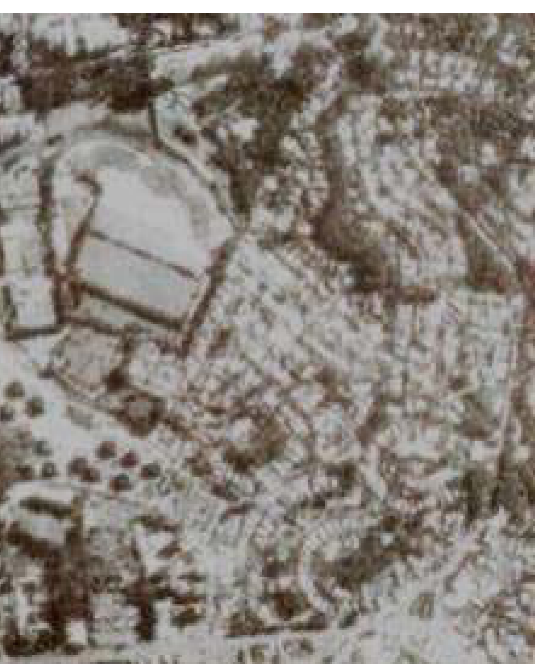
Figura 10B. Uso e ocupação do solo em 1994 (Fonte Base S/A).