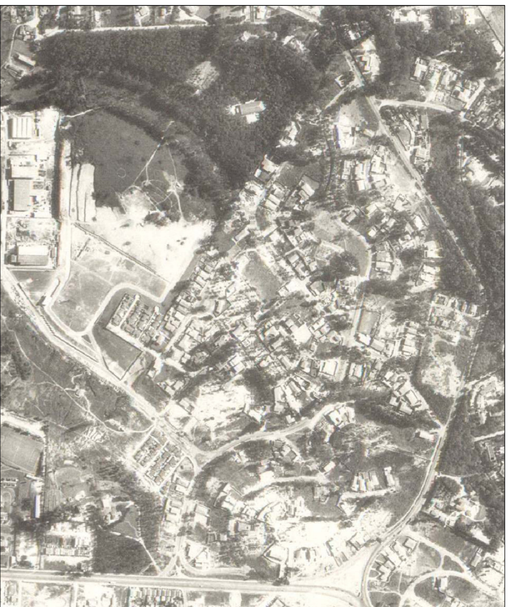
Figura 10A - Uso e ocupação do solo em 1972.