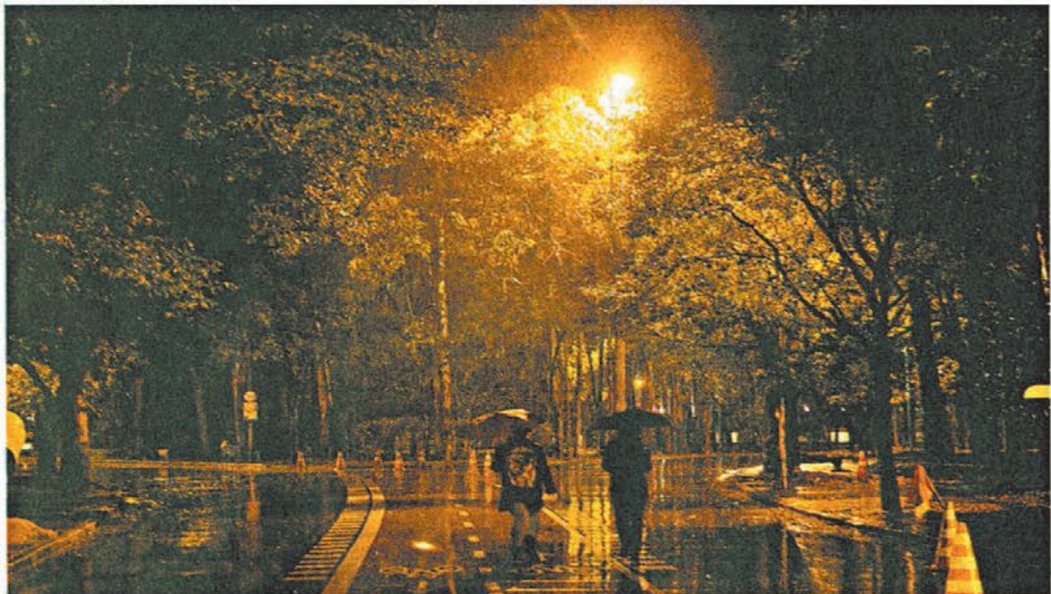
Iluminação atual do parque Ibirapuera, com lâmpadas de vapor de sódio ou mercúrio