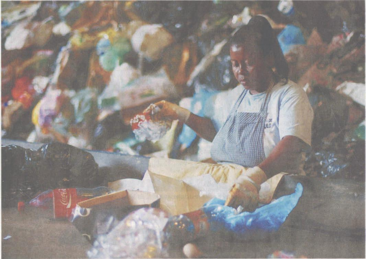
Recicladora em cooperativa do Bom Retiro, no centro de SP; cidade deveria ter coleta seletiva obrigatória desde junho