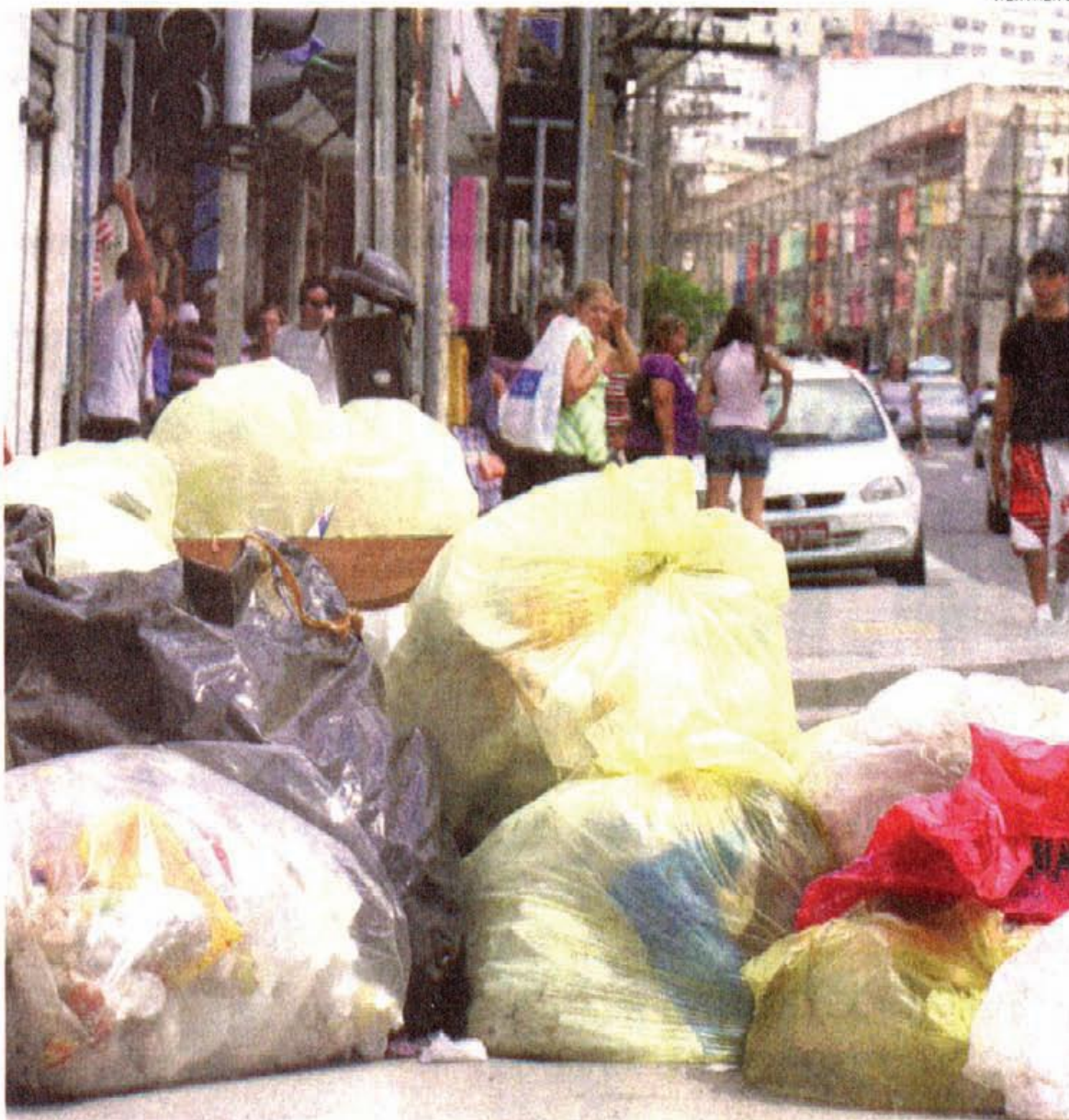
Lixo na Rua José Paulino, no Bom Retiro: hoje fiscalização da coleta é feita por 300 fiscais das s