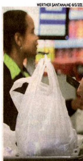
Restrição. Sacolas serão usadas com produto a granel

renda não será penalizado com a medida. Justamente porque é ele quem mais sofre com as enchentes”, diz o secretário.