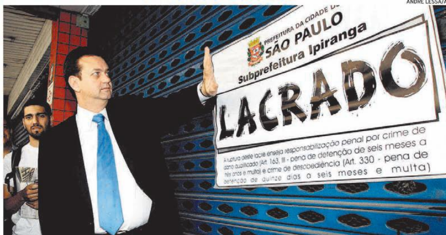
O prefeito Gilberto Kassab acompanha fiscalização que lacrou supermercado no Ipiranga por cinco dias

Na manhã de ontem, ele acompanhou a lacração do mercado da rede Hirata, na Rua Brigadeiro Jordão. O estabelecimento já havia sido multado três vezes depois do decreto em vigor, no valor de R$ 1.059. Agora, além da multa, ficará interditado por cinco dias e só