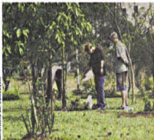
Crematório da Vila Alpina tem área verde no entorno