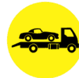
REMOÇÃO E PÁTIOS