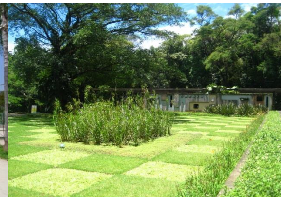
Parque do Povo