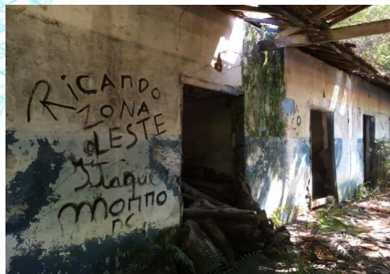
Parque do Trote