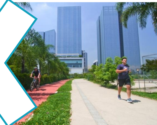
Parque Burle Marx