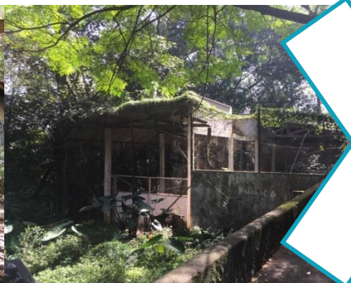
Parque da Aclimação