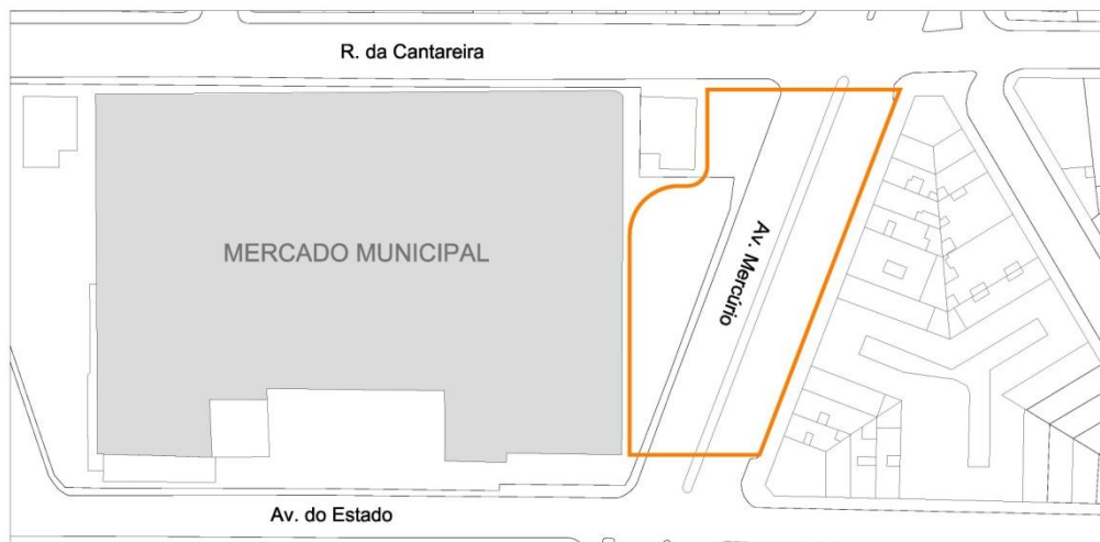
Figura 1 – Área de ocupação do estacionamento Mercado Municipal

mantendo afastamento de 5 (cinco) metros dessas; segue em linha imaginária com afastamento de 5 (cinco) metros dos edifícios até o encontro com o alinhamento predial na interseção com a Avenida do Estado; segue por fim pela Avenida do Estado até o ponto inicial.